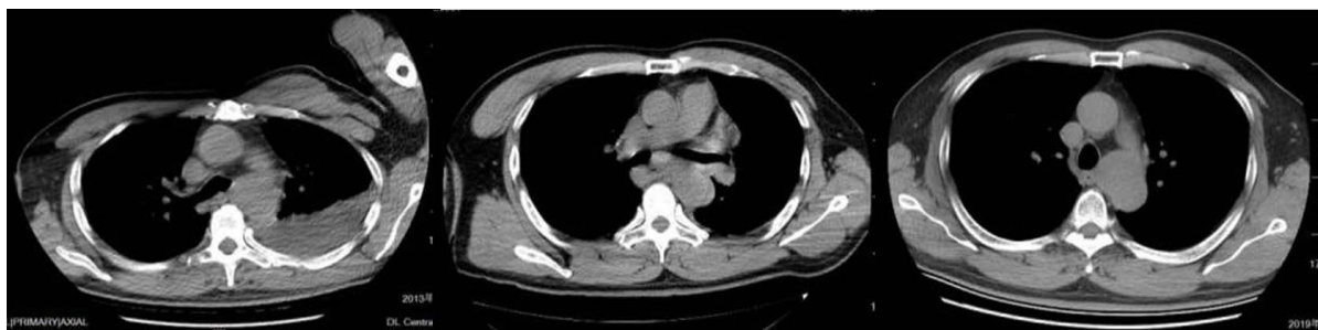
Figure 1. Post-traumatic follow-up (in chronological order)

患者，男，47岁，2012年6月9日因“车祸外伤后1小时”曾就诊于我院急诊。入院诊断：脾破裂；肱骨骨折；胫骨骨折。入院肺CT(图1)提示：降主动脉旁见渗出性改变。急诊术后，复查肺CT(图1)提示：上纵隔及降主动脉旁渗出性改变较前吸收，周围软组织密度影较前减少；左侧胸腔积液。出院6年后首次复查肺CT(图1)提示：主动脉弓降部管腔增粗，考虑可疑动脉瘤形成。未进一步行CTA检查及系统治疗。于2019年5月13日患者因“活动后胸闷不适1周”再次就诊于我院。既往高血压病史约3年，最高血压180/110 mmHg，应用氨氯地平5 mg 日一次控制血压，未规律应用降压药物及监测血压。入院查体：T: 36.3°C，P: 54次/分，R: 19次/分，BP: 130/74 mmHg，胸骨旁第二肋间可闻及杂音。血液生化指标未见明显异常，完善主动脉CTA可见降主动脉起始处前壁局限性外突影，大小约2.6 × 4 cm。进一步完善主动脉超声造影(图2)提示：降主动脉起始处内见瘤样膨出，管腔完整并与主动脉管壁相延续，可见降主动脉血流进入瘤体形成漩涡后排出，瘤体内未见明显血栓；降主动脉与肺动脉间可见实性异常回声，未见血流灌注。诊断：迟发性降主动脉起始处真性动脉瘤。