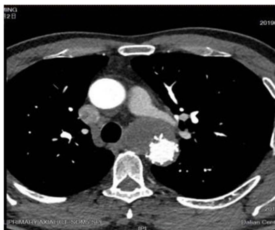
Figure 3. Postoperative intervention 图 3. 介入术后

2019年5月17日患者于全麻下行介入治疗，常规显露右股动脉，予行股动脉穿刺，预留缝合线，留置鞘管，以导丝导管交换技术置入导管至主动脉根部。主动脉造影示：主动脉弓降部局限性动脉瘤，瘤体较大，定位左锁骨下动脉开口提示支架锚定区不足。为扩大近端锚定区遂决定行“主动脉腔内隔绝术 + 左颈总动脉 - 左锁骨下转流术”。于左锁骨上行长约6 cm 横行切口，暴露左锁骨下动脉及左颈总动脉，阻断左锁骨下动脉采用人工血管与左锁骨下动脉行端侧吻合。侧壁阻断左颈总动脉，将人工血管另一端与左颈总动脉行端侧吻合(术中置入6 mm × 15 cm 人工血管、30~33#主动脉覆膜支架)。检查无漏血后，冲洗并关闭创口。术后经给予常规血管活性药物维持血流动力学稳定，逐步减停对症支持治疗，恢复顺利，无明显并发症，术后复查CTA (图3)显示支架贴壁良好，管腔通畅，其内造影剂均匀填充。术后超声：左侧颈总动脉流速80 cm/s，呈双峰改变，左侧锁骨下动脉流速55 cm/s，可见舒张期返流，人工血管血流通畅。主动脉超声造影提示主动脉支架内侧缘处可见降主动脉血流通过4 mm 缝隙进入主动脉瘤内，瘤体内血栓形成，约占瘤体80%。嘱患者出院后定期随访，出院医嘱应用阿司匹林 + 华法林3月后改为单用阿司匹林至术后1年。