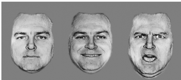
Figure 1. The stimuli examples of the facial expression pictures 图 1. 面孔图片示例

空间线索任务: 该范式改编于 Posner 等人(2008)设计的外周线索任务(exogenous cue task)。E-prime 程序被用于刺激的呈现, 呈现的背景为黑色。首先屏幕中央呈现注视点“+”, 两侧有两个长方形, 呈现时间 500~1000 ms, 然后在其中某一个长方形中呈现情绪面孔线索, 呈现时间 500 ms, 紧接着是一个 50 ms 的掩蔽, 最后是呈现于某一长方形中的靶刺激, 1 cm \times 1 cm 的黑色实心正方形“■”。被试任务是当“■”出现左侧按“1”键, 出现在右侧按“2”键, 呈现时间最长为 2000 ms, 被试按键消失(具体流程见图 2)。