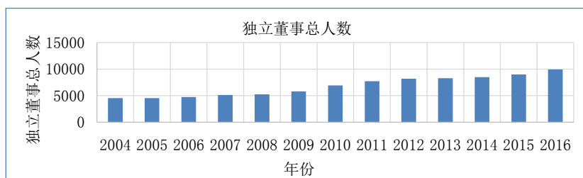
Figure 2. Change of total number of independent directors