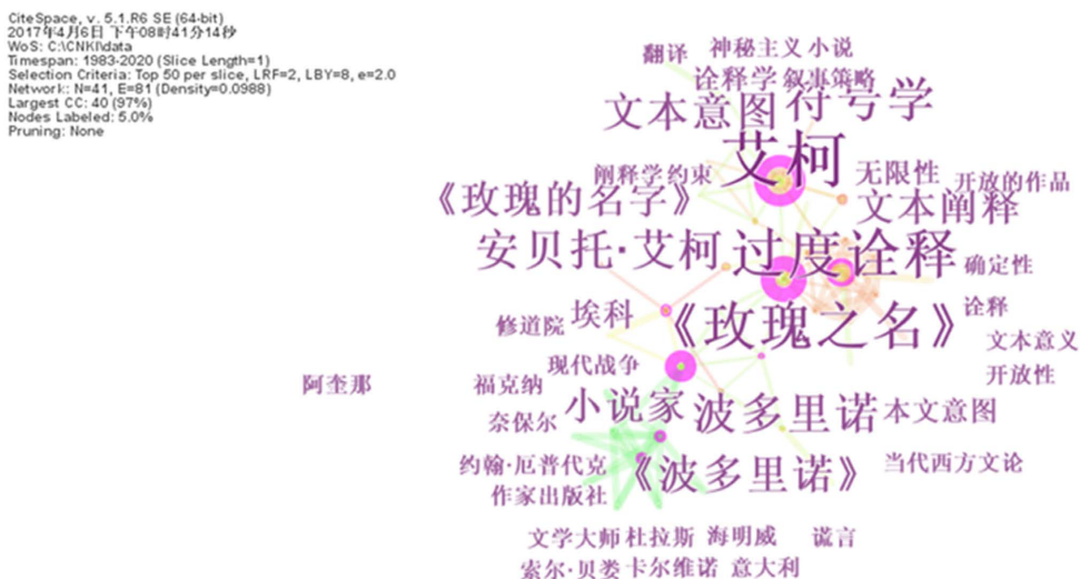
Figure 2. Keyword co-occurrence knowledge map of domestic Eco research 图 2. 国内艾柯研究热点知识图谱

[15],同时其依托其符号学理论提出反解构的诠释学理论也为当下的文本诠释实践提供了重要的理论依据[16]。因此,艾柯的诠释学和符号学思想也受到了学界的关注。