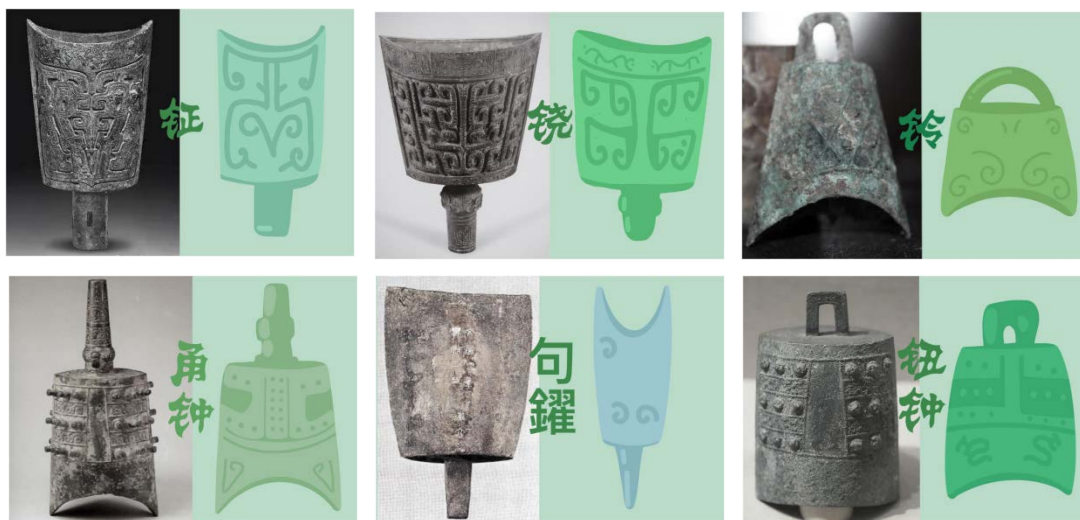
Figure 3. Bronze element visual refinement (Team draw)

具。为了避免色彩过于沉重造成压抑感而选用了较为轻柔的蓝绿色系设计，更加符合儿童的身心需求，见图3、图4。