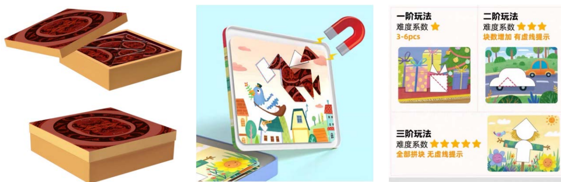
Figure 2. Dragon and phoenix element tangram design schematic diagram and play instructions (Team draw) 图 2. 龙凤元素七巧板设计示意图及玩法说明(团队绘制)

例如：将荆楚纹样中的龙凤纹进行提取，解构重组为新图案与传统的益智玩具七巧板进行结合，制作成认知类益智教具。如图 2 所示，龙凤元素七巧板教具玩法多样，在让儿童了解与认知龙凤符号的同时，又能根据不同年龄段的特点灵活的进行玩法切换。