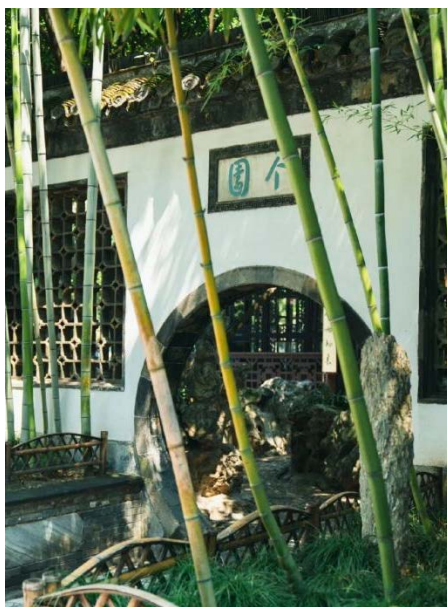
Figure 2. Garden in Yangzhou 图2. 扬州个园

深岩绝壑, 冬燠夏凉, 岩石相对恒温的特性使周围环境趋于“冬燠而夏不受暑”[18]。因此传统园林中常利用岩石堆叠创造避暑景观。清漪园清可轩在天然岩壁半围合的空间构建下, 形成了“夏屋含凉幕岩壁”, 使此处环境“四季皆致佳, 九夏尤宜盘”[19], 吸引乾隆帝夏日多次前来, 题刻大量感叹此处环境清凉的佳句。扬州以名园胜, 名园以叠石胜。在众多扬州园林的叠石之景中, 以个园叠石最具代表性(见图2)。陈从周先生在评价个园时便指出: “在个园建造时, 就有超出扬州其他园林之上的意图, 故以石斗奇, 采用分峰用石的手法, 号称‘四季假山’, 为国内唯一孤例”[20]。个园的假山在石材选择和植物配置等别具匠心, 呈现出园林景象可以使观者在游览时感受到四季的变换, 石笋春山、湖石夏山、黄石秋山和宣石冬山各具特色。夏山位居抱山楼西侧, 由太湖石堆砌而成, 在夏日骄阳的照射下阴影多变, 仿佛夏日流云, 又似山岳缩影。湖石之上植有松柏藤萝, 松柏连荫如盖, 紫藤蔓延飘香, 池中又有成片莲荷, 暗香浮动。池畔的广玉兰亭亭而立, 树影倒映于池中, 与灰白的湖石形成苍翠欲滴的画面, 为夏山多添几分凉意。太湖石虽如悬崖峭壁般高耸, 但根部强壮稳固, 其挺拔的气质胜过竹林树木、傲然的气色压过亭台楼阁, 一如夏季勃勃生长、奋发向上的精神。