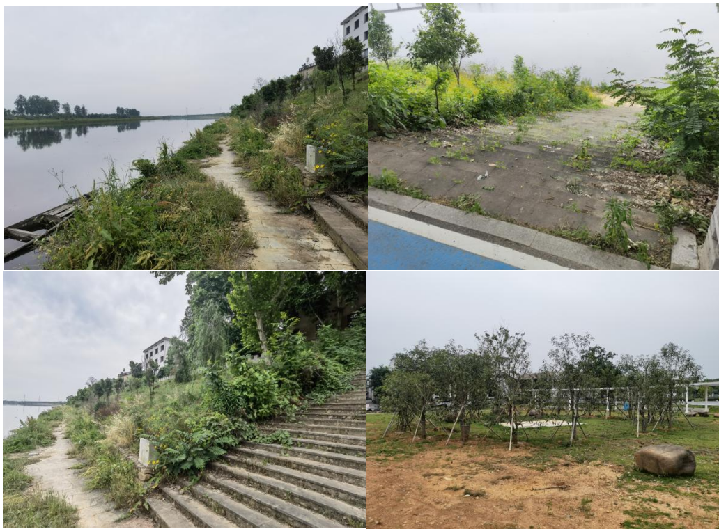
Figure 2. Current landscape status of Xinghuo Village Waterfront Space 图 2. 星火村滨水空间景观现状图

服务设施等都未带有鲜明的地域色彩, 缺乏当地特色文化的运用, 没有将村落滨水空间景观与星火村村落特色进行空间融合, 无法达到彰显浙江乡村文化特征和乡土特色的目的(见图 2)。