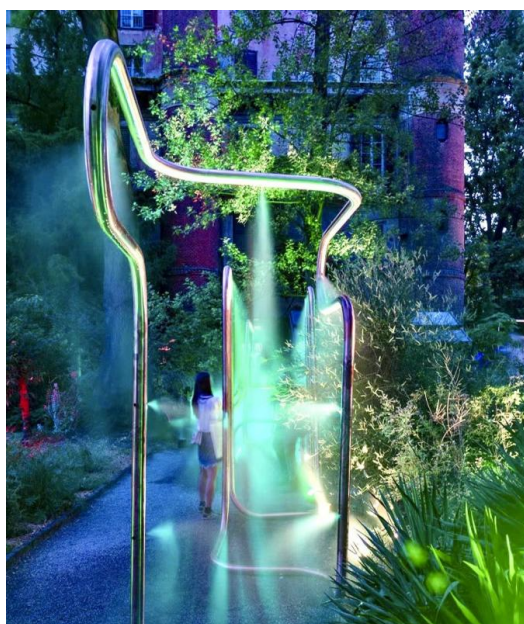
Figure 1. Splash zone interactivity device 图 1. 嬉水区互动性装置 ①