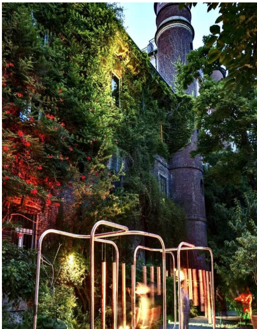
Figure 2. Nocturnal light-emitting device 图 2. 夜间发光装置 ①

在城市公共空间中，人们与自然景观互动。根据地理和气候因素，在整个花园中种植和维护地被植物、花卉、树木和灌木，从而创建一个富有吸引力、风景优美的城市公共空间花园。城市居民可以欣赏到花园中生长的花草树木，景观也会随着季节的变化而变化。春天有杜鹃花，夏天有凌霄花，秋天有银杏，冬天有国槐。此外，城市公共空间互动景观主要包括：带游戏区喷泉的池塘和带浅水池的嬉戏区[5] (如图 1)。其中，嬉戏娱乐区和带喷泉的水池采用了光电技术，人踩在嬉水区 and 喷泉上都会触发开关，而蹦床在夜间也会发光。浅水池中的喷水场在空间中营造出一种“水花四溅的体验”，水池底部也会根据力场的大小在夜间发光(如图 2)，从而引发人们在感官上与景观的互动，这三个互动景观激发了人们与景观互动的热情，还能协调环境温度和湿度，提高了人们对城市公共空间景观的整体兴趣[6]。