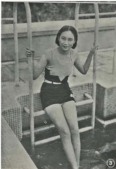
Figure 1. The 31st issue of “Purple-Red Water Fish”—Hu Die

的病态美。《妇人画报》在进一步输送身体健康之美观念的同时,也影响着民众的服饰需求变化,如第三期的《体育界》,第六期的《自治游泳衣》、第九期《华北运动会的女健儿》、第十期的《介绍几位人鱼》等内容中,运动装、学生装、泳装等服装种类频出,相比于常服,泳装和运动装对身体观念变化的表达更为直接。泳装和运动装开始从女性刻意遮盖身体到身体的自然呈现,如第三十一期《紫红色的水鱼》一文,刊登了一系列女性穿着泳装玩乐嬉戏的照片,其中还有著名影星胡蝶女士(见图1),她身着新潮泳装,展现出一种大方自然,阳光自信的状态,这也进一步从侧面映射出社会对于身体“健康之美”的审美转向。时尚关乎身体:它依身体而制造,借身体以推广,并由身体来穿戴。身体是时尚倾诉的对象,身体在各种社会场合必须着衣([1]: p. 1)。服饰和身体之间不存在完全的孤立状态,当服饰或身体时尚两者之间任意一方发生变化时,另一方都会受其影响而做出相应变化。《妇人画报》所传递的健康之美,一方面影响着女性的当下生活方式和审美观念,另一层面也影响了服饰的发展过程,为服饰的进一步发展提供了健康的体魄。