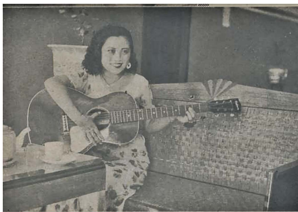
Figure 3. The 20th issue of Shining Beauty of Personality 图3. 第20期《个性美之闪耀》 ®

涵养二字可拆解为“内涵”和“修养”,是女性身心合一的长期追求。涵养之美区别于“健康之美”和“容姿之美”,前面两者聚焦于身体化的美是外在的时尚特征,后者的“涵养之美”是身体内在性的美。一般关于身体的美学可能既包括了对于身体的身体化的理解,也包括了对于身体的非身体化理解。非身体化的理解是最惯常的和多方面的。人们认为身体和心灵虽然是不同的,但又统一于人自身[11]。在探讨身体时尚时切不可仅仅围绕表面的身体,而忽视了身体时尚中外在和内在的统一性。个体美丑与否不是单凭外在便可定夺的,内涵和修养同样重要,倘若女性过于关切外在的装饰和考量,一定程度上将失去中国女性独有的气韵。郭建英在第十七期的《编辑余谈》中则写道:“中国女子之美,无论是古典的或现代的,是包含着悠久的历史与传统的习俗下所发展的特殊的美。它在世界上占有显著而荣耀的名望,决不能被外国女子之美所得浸染或影响的。我们希望她们在保持她们固有之外表美之际,同时更努力于助长她们内容方面的美点;因为后者在个人的整个美上较前者更为重要的东西”[12]。涵养之美带着《妇人画报》对女性的期待,期许时下女性能丰富自己的内在,不至于被西方纷繁杂乱的审美思想失去自己的独立思考和判断,这种身体形象上的气质是外在装饰无法比拟的,这种气质来自读书、修养、内涵和阅历对于自身魅力的沉淀。与此同时涵养之美也为外在的着装增加光彩,服饰与身体是相辅相成的,身体的外在性为服饰提供载体,而身体的内在性为服饰提供了灵魂,没有灵魂的存在,再美的服饰都将黯然失色。