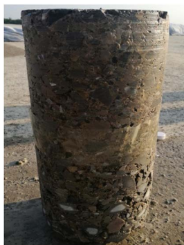
Figure 1. Cement stabilized macadam core sample

水泥稳定碎石基层摊铺完成后，首先，分别采用分层灌砂法和灌水法对水泥稳定碎石基层的压实度进行检测，试验结果见表 2。养生 7 d 后在铺筑的水泥稳定碎石基层中取芯，芯样为直径 150 mm，高度 150 mm 圆柱体试件(图 1)，并对芯样试件进行无侧限抗压强度试验。