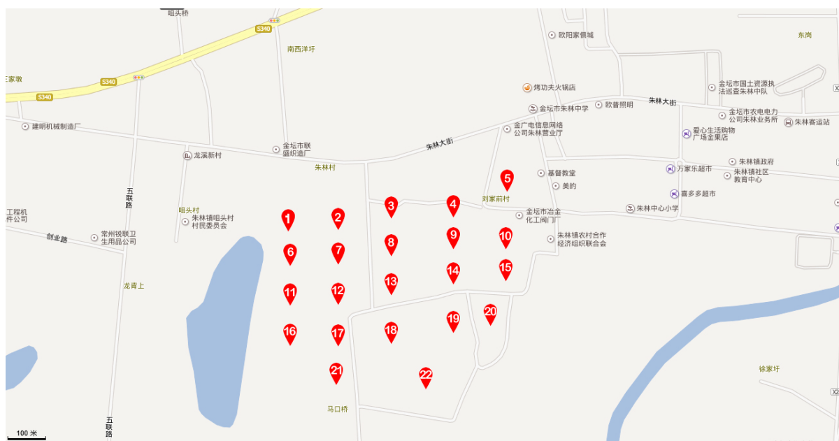
Figure 1. Distribution of sampling points

分别用砖砌水泥砂浆粉刷成 1 m × 1 m × 1 m 芹池 6 只，用于池栽试验。供试品种扬州白芹，小区试验肥料均按常规施肥方法和数量，供试土壤铅含量为 25.92 mg/kg。另配氯化铅水溶液进行全生育期灌溉，设三个浓度处理，处理 I：清水对照 Pb 0.00 mg/L；处理 II：Pb 0.04 mg/L；处理 III：Pb 0.05 mg/L，重复 2 次，每小区面积 1 m 2 ，合计 6 m 2 。