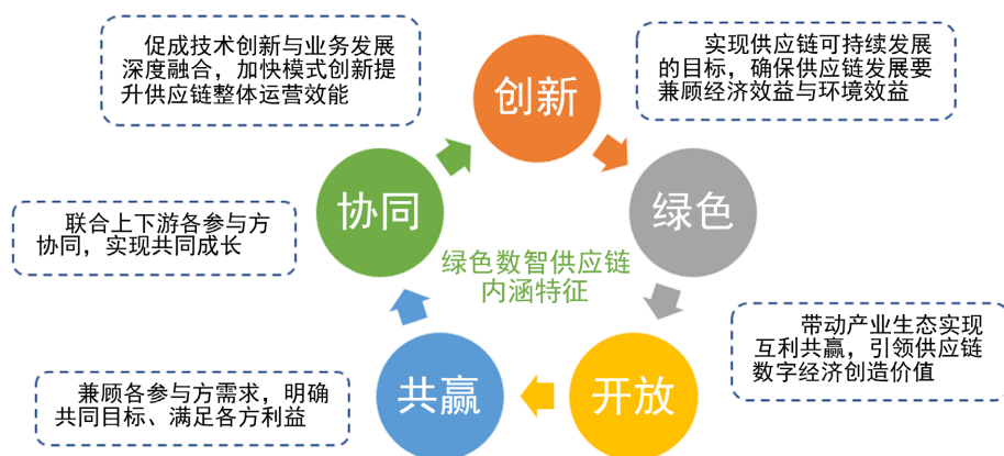
Figure 2. Connotation and characteristics of green digital intelligence supply chain 图 2. 绿色数智供应链内涵特征

现互利共赢，引领供应链数字经济创造价值。“绿色”是为实现供应链可持续发展的目标，确保供应链发展要兼顾经济效益与环境效益(见图 2)。