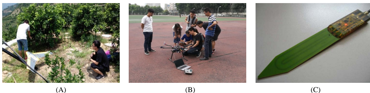
Figure 2. Images of field monitoring tools ((A) Fixed-wing UAS; (B) Multirotor UAS; (C) SPADE probe) 图 2. 野外作业中常用监测工具((A) 固定翼无人机; (B) 多旋翼无人机; (C) SPADE 探头)

Identification, RFD)精确监测动物栖息地变化[26]; 偏远地区生态监测中, UAS 可以快速获取较高精度的制图数据, 影像地理范围误差一般小于 2 m [27]。UAS 应用主要受人力成本、计算机软/硬件费用、维护和技术指导等因素影响。日益便捷的 UAS 技术正在生态系统过程监测、植被资源调查和野生动物保护等方面发挥重要作用。