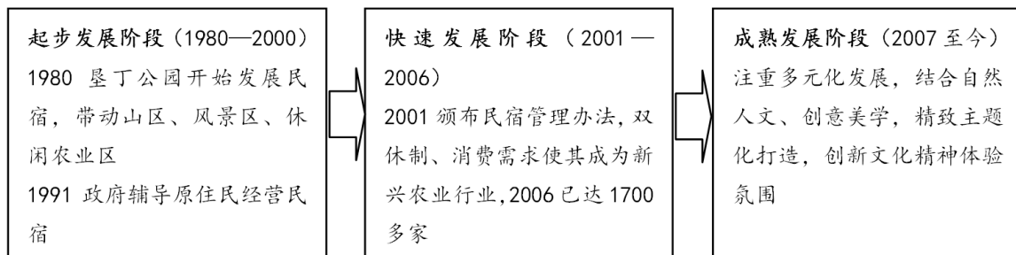
Figure 3. Development of home stay facility in Taiwan [21]