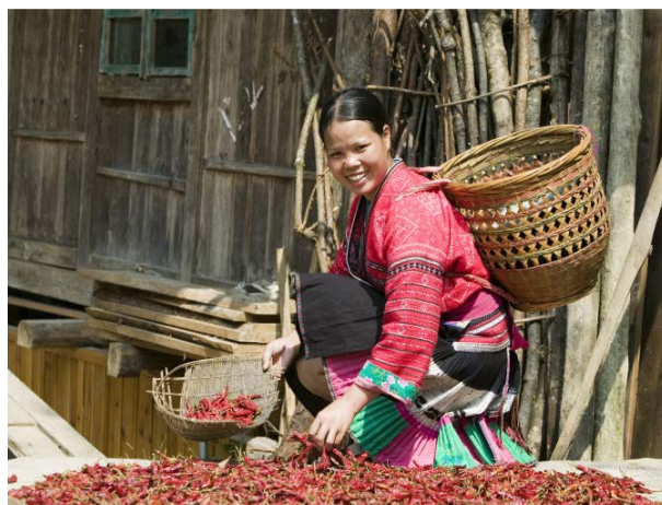
Figure 3. Yao people 图 3. 瑶族人民

随后教师播放一段龙脊梯田的介绍视频和相关图片作为本节课的导入，让学生在视频中寻找问题的答案，让学生对龙脊梯田有大致地了解，这一活动融入多模态教学理念，将语篇中的信息转化成生动的图文资源呈现在学生面前，不仅能激发学生的学习兴趣，对语篇主题形成更加深刻的认知结构，同时还能训练学生对信息的快速抓取能力以及思考和预测能力。同时教师能够通过课堂提问，检测学生课前预习的情况，基于学生的回答对学生的学习进展做初步评估。