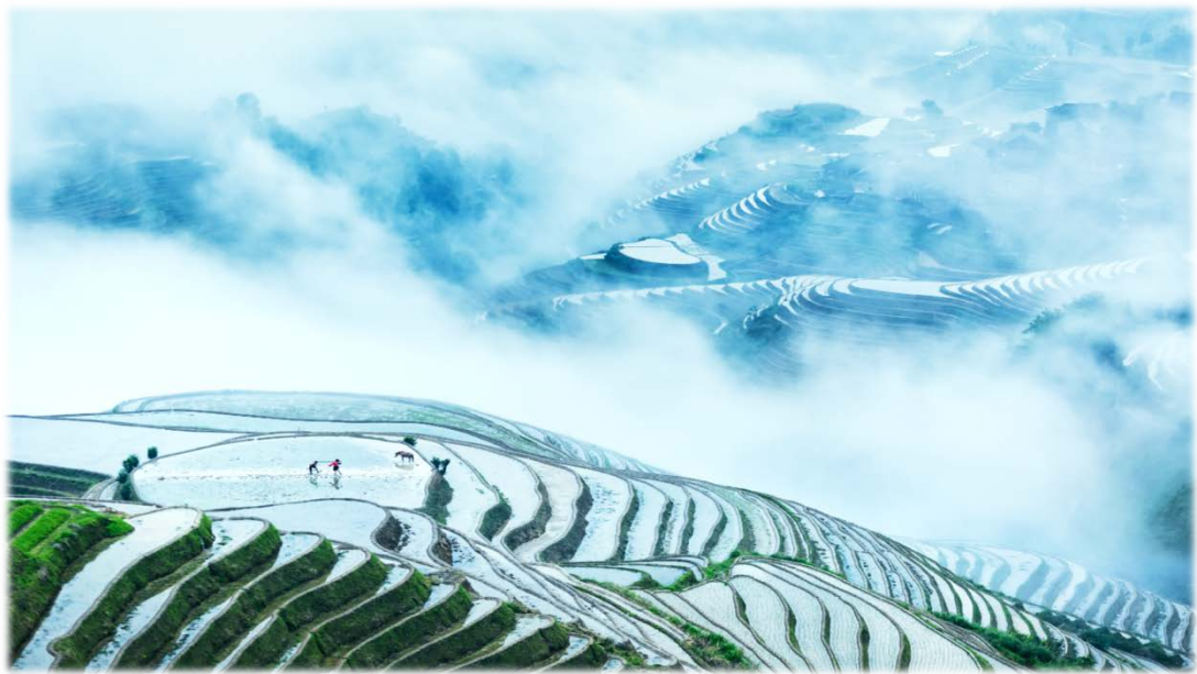
Figure 1. Longji Rice Terrace landscape map 图 1. 龙脊梯田风景图

Step 1: 多媒体导入。教师首先呈现一张龙脊梯田风景图(如图 1)以及两张当地人民的图片(如图 2 和 3)，引导学生形成对“Longji Rice Terraces”主题的猜想，例如“Where is this place?” “What’s the relationship between the terraces and the local people?” 并且结合教材中的问题，引导学生的感知与注意，激发学生的学习兴趣，同时激活学生的背景图示，为本单元的主题理解做好铺垫。