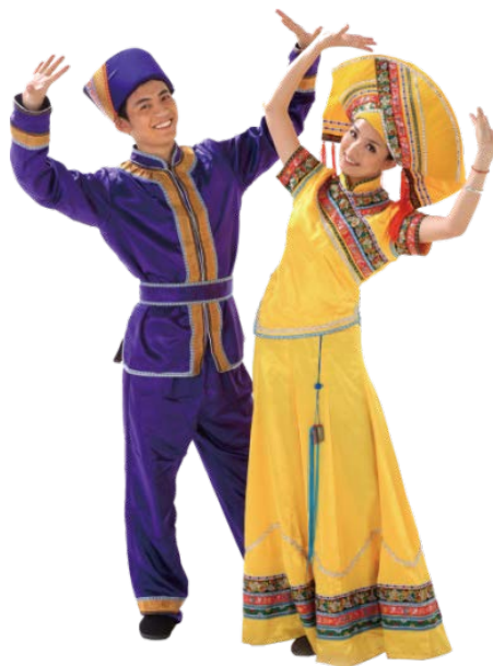
Figure 2. Zhuang people 图 2. 壮族人民