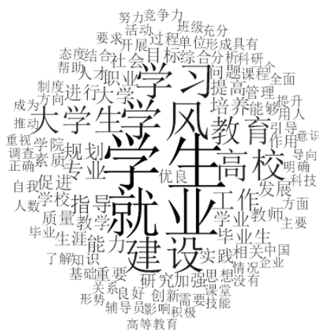
Figure 1. Word cloud based on literature related to “academic atmosphere construction in universities” and “employment of college students”

能否培育出综合素养优秀、适应力强的毕业生以符合职场要求，这在本质上触及到高等教育机构的人才培育模式，特别是学术风气的塑造。优质的学术风气不仅对每一个学生的全面发展起到关键支持作用，也是确保他们成功就业和实现长远发展的基础保障。通过在中国知网上搜索“高校学风建设”与“大学生就业”相关文献，以被引量前五的文献为样本，运用 Nvivo 的定性分析软件对文本数据进行词频统计，生成了如图 1 所示的“词汇云”。字体的尺寸直接反映了词汇或短语在文本中的频率，尺寸越大，出现的频率越高。据此可看出，“高校学风构建”与“大学生就业”是高等教育机构人才培养的核心任务。加强高校学风建设，对于提升大学生的就业竞争力以及推动高校就业服务具有显著的现实意义。