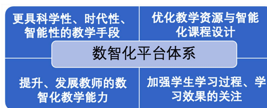
Figure 2. Digital platform system

在单元学习后的延展学习阶段，教师利用数智化平台如“雨课堂”、“SPOC”系统等，给学生布置进行延展学习的任务，如口语练习任务、词汇与语法习题任务、课后阅读任务、写作练习任务、翻译练习任务、电子杂志制作任务、戏剧表演任务、问卷调查量化研究模拟练习任务等，如图2所示，对学生进行数智化、过程化管理，以科学化、系统化的方法解决语言操练单一化、片面化、孤立化的问题，在全面提升学生的认知水平与语言能力的同时培养学生优秀的思想品格。