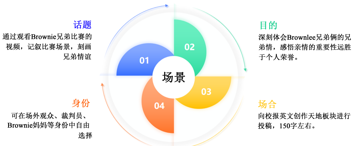
Figure 2. Four key elements of the output scenario in the case study 图 2. 案例中的产出场景四要素

挑战性的思政话题, 让学生身临其境、感同身受。体现 POA 要求的“交际真实性”“认知挑战性”和“产出目标达成性”[10]等特点, 还兼顾了实用性、时新性和批判性, 贴近学生认知特点和客观需求[11]。产出场景需要包含了话题、目的、身份和场合四个要素(如图 2)。