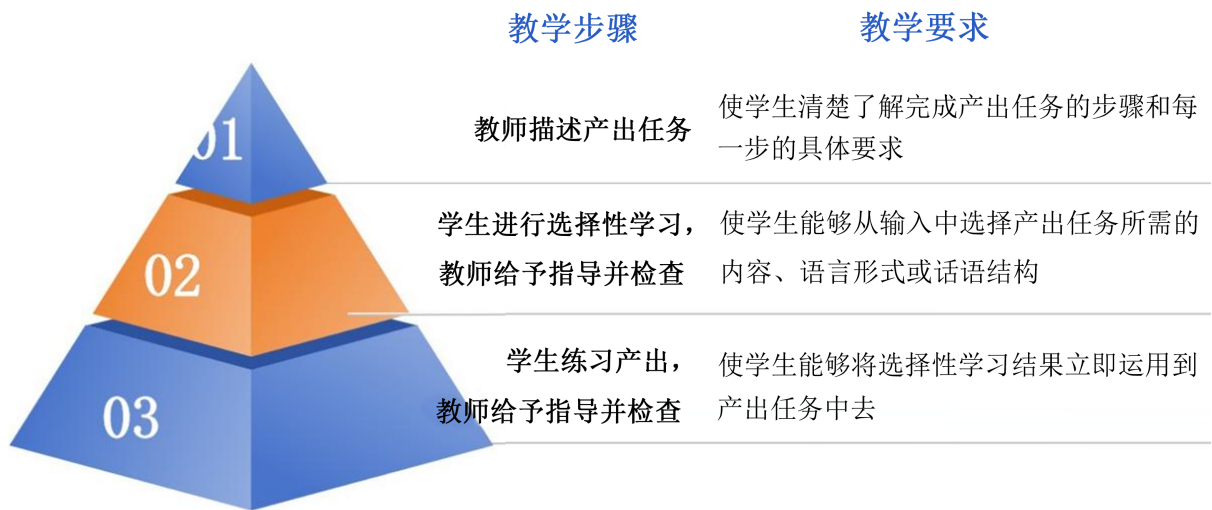
Figure 3. Enabling teaching steps and requirements 图 3. 促成的教学步骤和要求

学生通过课前视频的观看, 课上图像的呈现, 教材文本的阅读等与本课程内容相关的多模态学习资料的接触与学习, 来帮助其建立多方位思维。