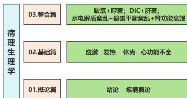
Figure 2. Curriculum content modules

在课程目标的引导下,重新梳理课程教学内容,深度优化教学设计,以确保学生扎实掌握专业知识的同时,同步实现其关键能力培养、学科素养提升及社会主义核心价值观的塑造。具体而言,将教材内容系统重构为“概论篇”、“基础篇”与“整合篇”三大教学模块(如图 2)。