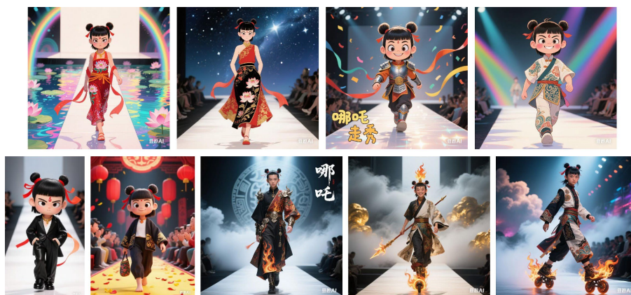
Figure 3. Display of some students' works

作品展示时，每个小组的作品都巧妙地体现了思政元素，带着思政和科技结合起来的活泼新鲜的感觉，有的作品可参考图 3。学生们在小组内讨论、动手的过程中团队协作、解决问题能力都有了一定的提升，也让之后的学习、工作有了一些基本的准备。