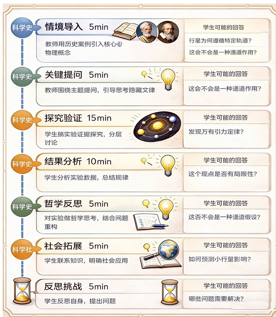
Figure 1. Teaching process design of “Newton’s First Law” integrating HPS 图 1. 融合 HPS 的“牛顿第一定律”教学流程设计

学生从经验认识走向理论理解。此外，我们引入科学哲学反思环节，围绕“科学规律如何建立”“模型与现实的关系”等问题展开讨论，帮助学生理解科学知识的建构过程及其方法论意义。随后，通过联系现实问题与社会情境，将所学知识迁移至实际应用中，强化科学知识的价值导向与社会意义。