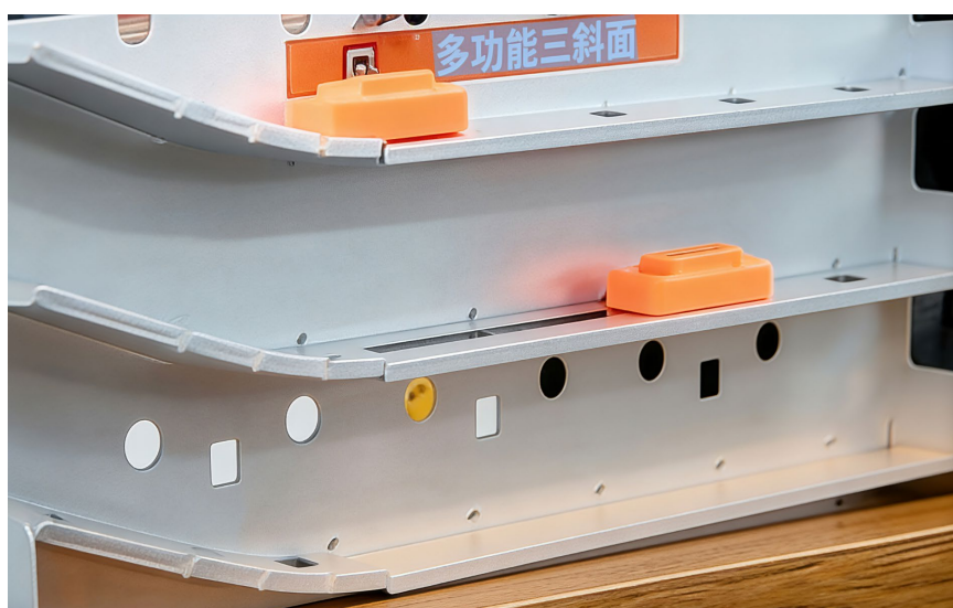
Figure 2. Three inclined plane experimental setups

这一教学活动不仅有效培养了学生的实验探究能力，更深化了他们对物理定律的理解。此举充分体现了核心素养中的科学探究要求，既激发了学生主动学习物理知识的热情，又引导其领悟科学探究方法的精神与培养科学探究能力。同时，学生通过亲手实验，也能更切身体会到科学研究的独特乐趣与深层价值。这将有助于他们确定未来的目标，并鼓励他们为实现这些目标而努力奋斗[5]。