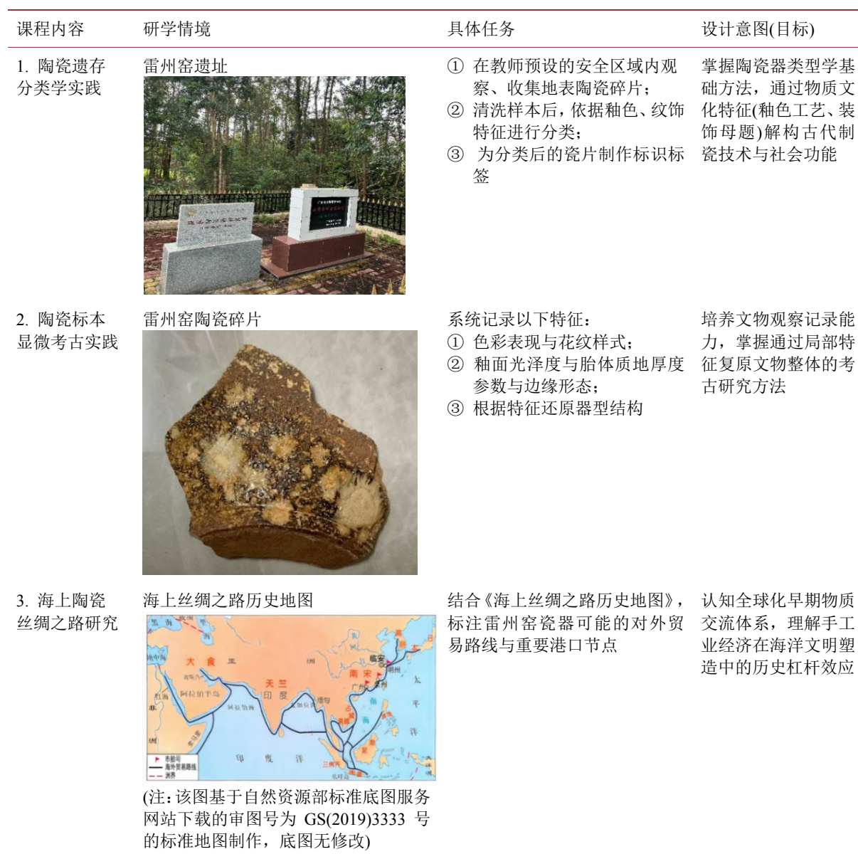
表 2. 研学课程安排