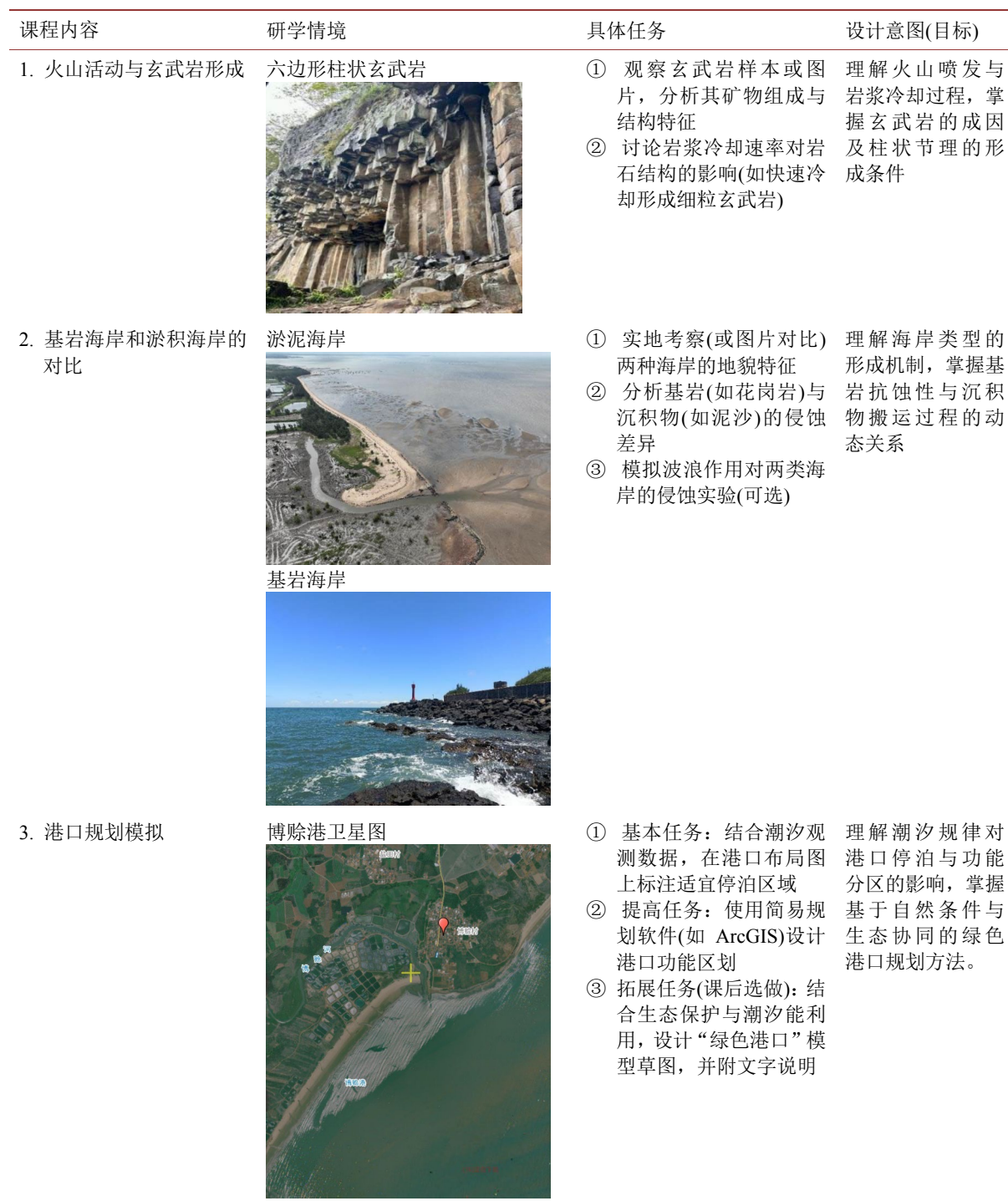
表 3. 研学课程安排