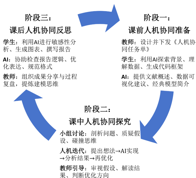
Figure 1. Three-stage human-AI collaborative teaching model 图 1. 三阶段人机协同教学模式

基于上述教学理念，我们构建了贯穿教学全周期的三阶段人机协同教学模式(见图 1)，各阶段师生与 AI 分工明确，协同推进。