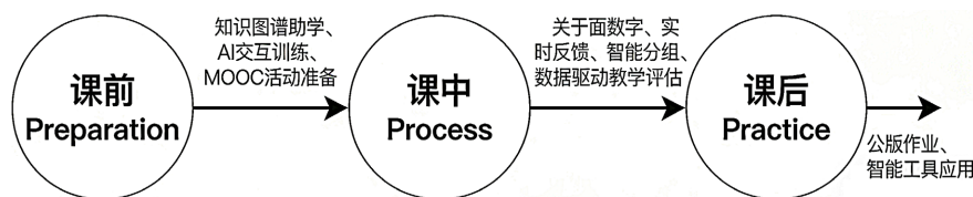
Figure 3. 4P teaching model: Digital empowerment

2025年4月出台的《关于加快推进教育数字化的意见》中明确指出: 大力推进国际化, 持续增强数字教育国际影响力。由于国情课对象的特殊性, 要求其提供“视听化”丰富多元的线上资源和辅助性的“语言支架”, 已有开始探索以人工智能深度媒介赋能来华留学生国情教育的范例[12]优质课上, 笔者在优质课现场观察到各高校正在积极开发数字化国情课资源, 如慕课和智慧教育平台上线的在线精品课程, 师生利用各种国内外媒体平台进行应用推广, 讲述中国故事。教师熟练运用词云锁定热门话题, AI定制文化动图和小视频素材、使用“雨课堂”进行课前任务布置-课中弹幕互动-课后互评。某高校创设的4P教学模式将数智化手段贯穿于国情类课程教学的全过程中(如图3), 游戏设计已应用在国情课中(某高校开发了语言文化闯关系列游戏, 某院校开发了“丝绸之路”商贸模拟游戏), 学生运用智能NPC、AI工具和手机应用软件分享发声, 互动无时不在, 留学生正成为中国故事的传播者和代言人。“智能化手段应当以‘人’为本”, 放在国情教育的语境下, 就是智能化内容手段的设计和运用应当服务于留学生受众的国情育人目标, 讲好中国故事, 而不是教育者简单的“炫技”。