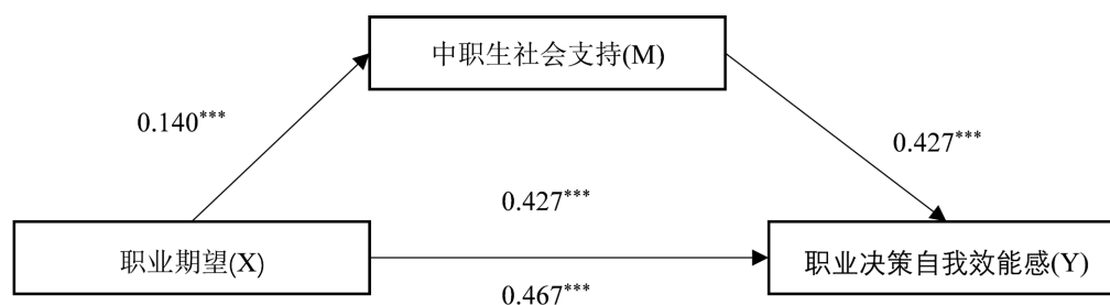
Figure 2. Mediation model of social support between career aspirations and career decision self-efficacy

根据温忠麟、叶宝娟(2014)判断中介的标准: 当自变量的回归系数减小到不显著水平时, 中介变量起到了完全中介作用; 当自变量的回归系数减小, 但仍达到显著水平时, 说明中介变量只起部分中介作用。因此, 职业期望通过社会支持影响职业决策自我效能感, 同时也对职业决策自我效能感起直接作用, 即中职生社会支持在职业期望和职业决策自我效能感之间具有部分中介作用, 中介效应占总效应的比例为 a*b/c = (0.14*0.284)/0.467*100\% = 8.5\% 。作用模型如图 2 所示。