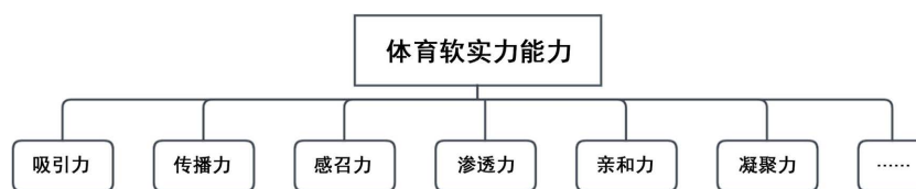
Figure 2. Soft power capacity in sports