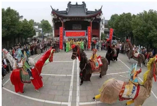
Figure 1. Dongba Dama lantern intangible cultural heritage skills physical map