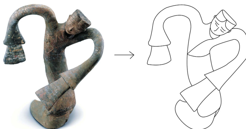
Figure 2. Extraction of the contour of the female dancing figurine wearing a pottery wrapped-around dress from the Western Han Dynasty