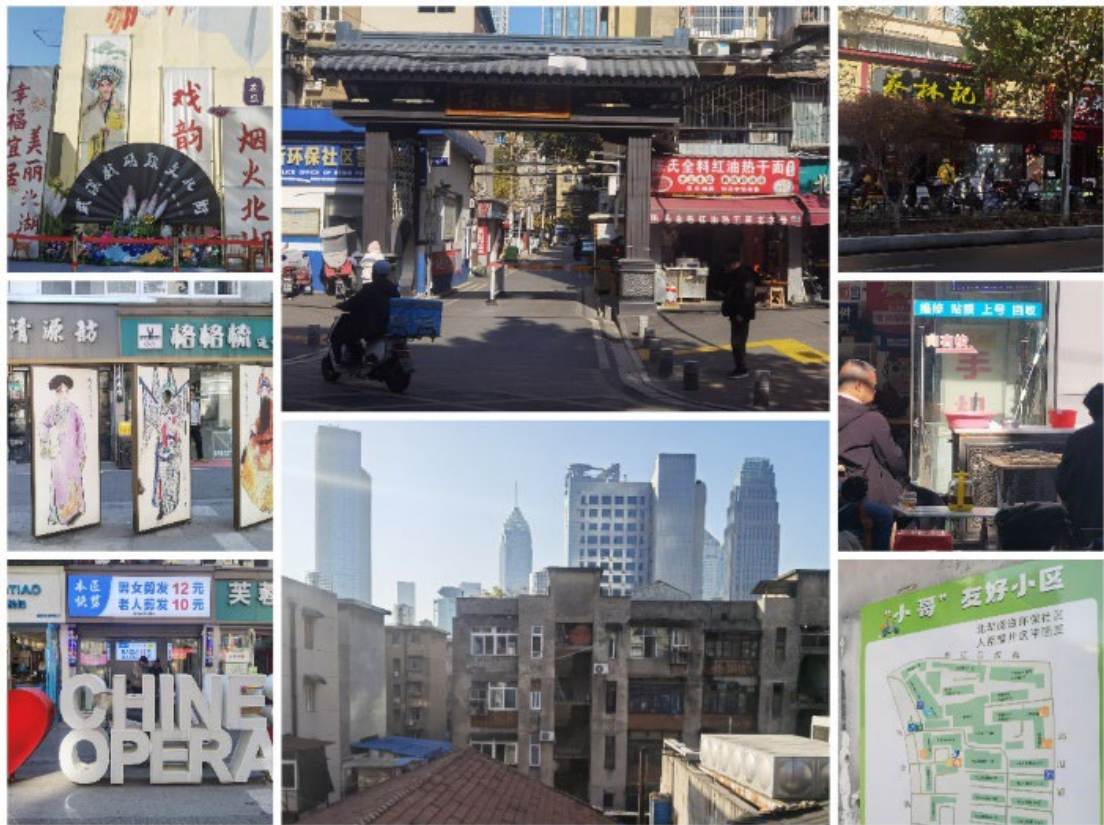
Figure 2. Architectural landscapes and street daily life in Huanbao Community of Wuhan City

City Walk 作为一种方法应用于城市地理实践教学，不仅要遵从人们在轻松氛围中探访、交流、讨论、记录和感悟的愿望，还要注意漫游的行前、行中和行后的系统串联。从地理实践教学的完整性讲，从漫