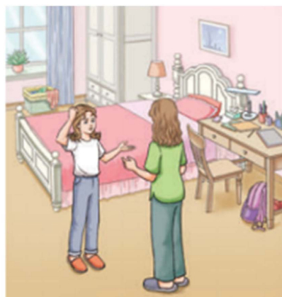
Figure 2. Section B (P10), Starter Unit 2: Keep Tidy! 图 2. Starter Unit 2 Keep Tidy! 中 Section B (P10)

Ella: Mum, I can't find my new cap. Mum: Your new cap? What colour is it? Ella: It's red. Mum: Is it in your schoolbag? Ella: No, it isn't. Mum: Oh, here it is. It's under your desk. You need to keep your room tidy. Ella: OK. Sorry, Mum.