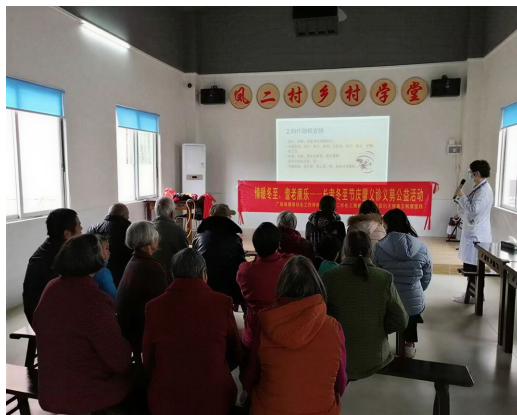
Figure 3. Happiness canteen carries out public welfare activity 图3. 幸福食堂开展公益活动

首先，在空间资源层面，村集体将闲置祠堂改造为公共服务空间，实现了“存量资源再利用”。祠堂原本承载宗族文化与公共议事功能，经改造后转化为助餐场所与公共活动空间，降低了场地建设成本，提升了资源使用效率。从资源适配角度看，祠堂空间的再利用不仅降低了固定资产投入成本，更重要的是减少了制度转换成本。相较于新建公共服务场所，祠堂作为既有公共性空间，在村民认知结构中已具备公共属性，其功能转化更容易获得社会接受。因此，这种空间适配并非简单物理改造，而是基于既有制度认同基础上的低成本嵌入。