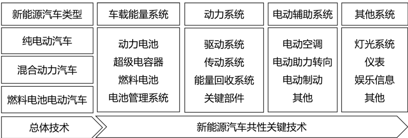
Figure 1. Framework of curriculum knowledge systems 图 1. 课程知识体系框架

在设计课程知识框架时,充分考虑智慧教育的需求,对课程的教学内容进行了深入分析,重新设计课程的知识体系框架。如图 1 所示,以新能源汽车总体技术和共性关键技术为主线来构建,将课程内容进行分类和重组,形成了清晰的课程知识体系。在这个体系中,总体技术覆盖了纯电动汽车、混合动力汽车和燃料电池电动汽车三种类型的新能源汽车,而共性关键技术则涵盖了动力系统、车载能量管理系统、电动化辅助系统和其他系统。车载能量系统是动力的载体,负责存储和提供电能;动力系统是能量的转换和传递者,将电能转化为机械能,驱动车辆行驶。所有教学内容都围绕能量的转换、存储、利用,以及动力的产生、控制和管理展开。