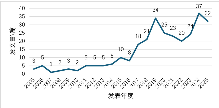
Figure 1. Trend chart of policy document output on group-based school development in China, 2005~2025

CiteSpace 软件作为知识图谱分析工具，能够系统性揭示研究领域的知识结构、热点演进与前沿趋势 [7]。本文运用 CiteSpace6.3.1 版本，通过构建义务教育优质均衡发展领域的共现网络与聚类图谱，有助于研究人员了解相关研究信息，把握研究动态直观呈现该领域的研究样态[8]。研究数据源自中国知网(CNKI)数据库，检索策略采用“基础教育” AND (“集团化” OR “集团化办学” OR “集团化办学模式” OR “名校集团” OR “教育集团”) AND (“教育公平” OR “优质均衡” OR “教育资源配置”)的组合检索式，限定篇名、关键词进行复合检索，时间跨度为 2005 年至 2025 年。选取 CSSCI 来源期刊(含扩展版)及北大核心期刊作为文献来源，经人工筛选后获得 289 篇有效文献。将文献以 Refworks 格式导出并转换为纯文本文件，提取作者、关键词、机构等节点信息，结合聚类分析和突现词检测等，系统解析集团化办学的研究热点分布、主题演进路径及发展动态。