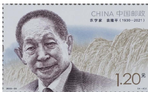
Figure 3. Yuan Longping commemorative stamp

载体呈现：展示邮票实物图(如图 3)，聚焦“袁隆平院士田间科研”场景，引出核心问题：“‘禾下乘凉梦’的实现，离不开分析化学的精准赋能，其具体作用体现在哪里？”