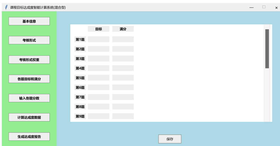
Figure 5. Interface for question objectives and full marks

“各题目目标和满分”界面设计了试题、各题对应课程目标和各题满分框架表格, 用户根据试卷类考核方式的具体内容, 将对应考核结果填入相应的输入框。为应对试卷类考核方式中试题数较多的情况, 系统调用了 tkinter 库中 Scrollbar 函数设置了滚动条, 方便用户进行滚动操作。“各题目目标和满分”界面如图 5 所示。