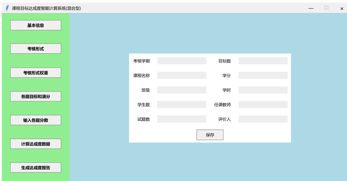
Figure 2. Basic information interface