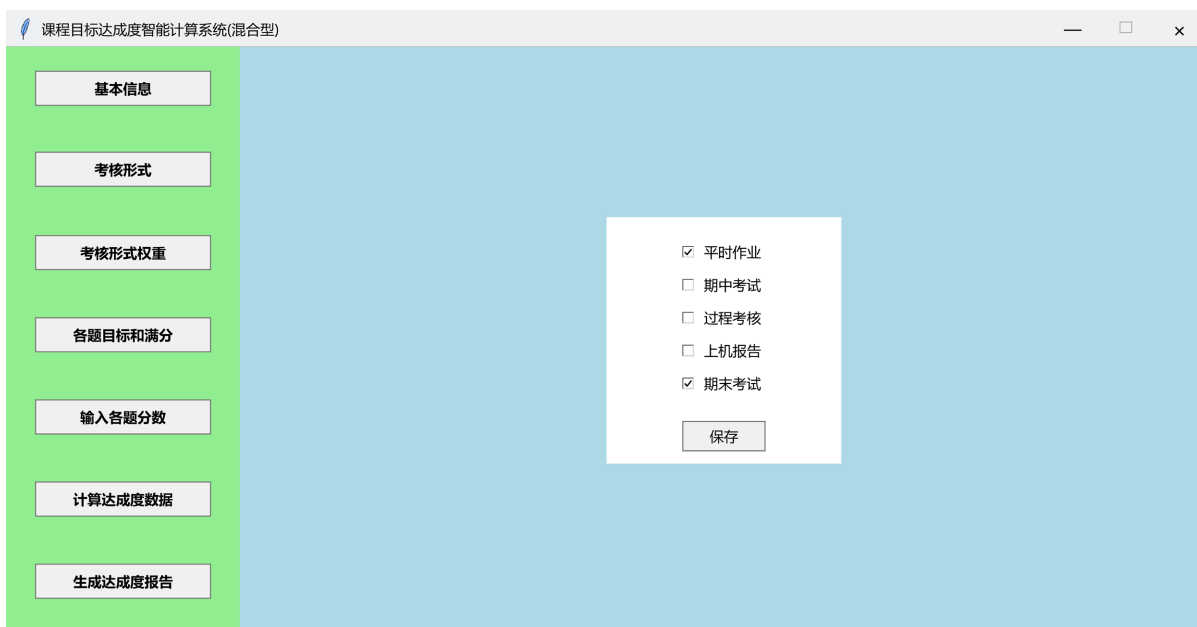
Figure 3. Assessment format interface