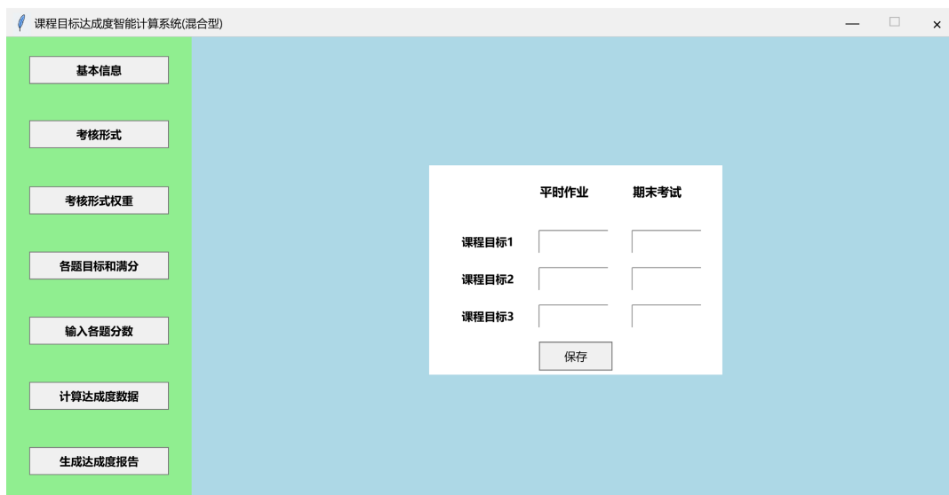
Figure 4. Assessment format weight interface