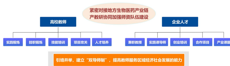
Figure 3. Path for strengthening teacher team building through industry-education-research collaboration

立足商洛“秦岭药库”资源优势，开发“秦岭特色药材深加工”“药食同源新产品”等本土化实践项目，将地方产业特色转化为实践教学独特素材。同时，针对教师实践能力滞后问题，通过企业挂职、项目合作等方式提升教师实践指导能力，形成教师自主发展的长效支撑机制。如图 3 所示，具体包含以下措施：