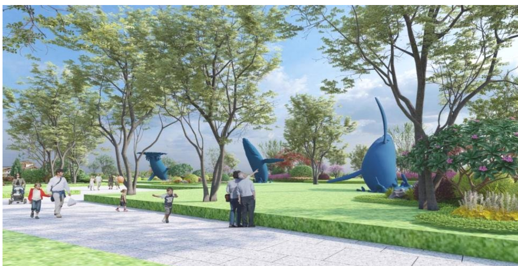
Figure 3. Children's fun park 图 3. 童趣乐园

其三, 营造体验美学场景, 激活情感互动空间。乡村景观的美学价值并非仅停留于视觉观赏层面, 更需实现使用者的深度参与和互动。设计中可通过节点营造实现这一目标: 例如沿田间步道设置木质栈道, 为游客提供近距离接触稻田、感知作物气息的体验路径。设置“大鱼”形象艺术雕塑, 以柔和的形态与鲜活的视觉语言, 将童话感融入空间场景, 让儿童在与雕塑的互动中感受趣味, 唤醒儿童的游玩兴致与探索欲, 契合童趣对“梦幻乐园”的追求。