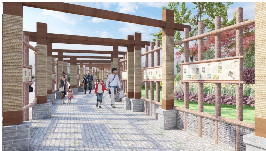
Figure 2. Memory gallery 图2. 记忆展廊

与的设计交流活动,开展社区共建活动(图2),帮助村民提高审美认知,让他们更清楚自己家乡文化的价值。这样做能解决“文化底蕴不足”和“村子空心化”带来的问题,让村民从文化传承的旁观者,变成主动去守护、去传递的主角。