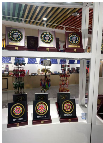
Figure 5. Sales area 图 5. 销售区