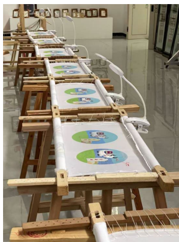
Figure 6. Training area 图 6. 培训区