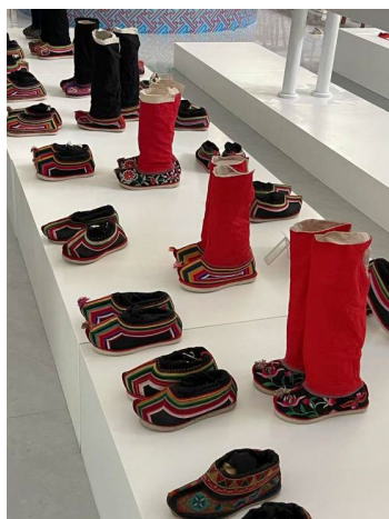
Figure 4. Exhibition area 图 4. 展示区