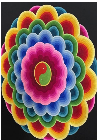
Figure 2. Sunflower pattern 图 2. 太阳花纹样