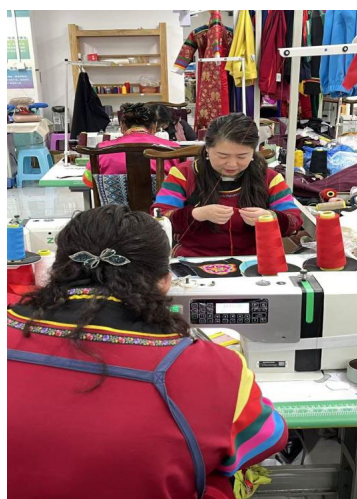
Figure 3. Production area 图3. 制作区

土族盘绣工坊作为土族盘绣技艺、纹样与色彩体系的重要载体，不仅承载着土族的审美表达，更蕴含着自然崇拜、生活哲理与族群记忆。由此可见，工坊不仅是盘绣技艺的技艺操作、传承的场所，更成为了土族文化交织生成与持续发展的物质空间。值得关注的是，“活态传承”是土族盘绣工坊的核心要义，其决定了工坊的文化内涵。在工坊中，绣娘通过制作、展示与传承等实践活动，使空间转换成为了文化符号的物化载体，实现了技艺与意义的延续。此外，文化实践载体的物质空间，其属性是工坊功能实现的基础。这体现在其物理形态的建构上，包括明确的场地选址、按功能划分的区域布局(如制作区、展示区、销售区与培训区)(见图3、图4、图5、图6)，以及相应的生产工具配置，这种实体空间为技艺传承与生产经营提供了必要条件。正因如此，工坊在选址上往往与土族聚居区协同共生，既便于绣娘就近参与，也能借助地域文化氛围增强自身的文化辨识度，使工坊的物质空间不仅具有实用功能，也成为地域文化的一种具象化表达。