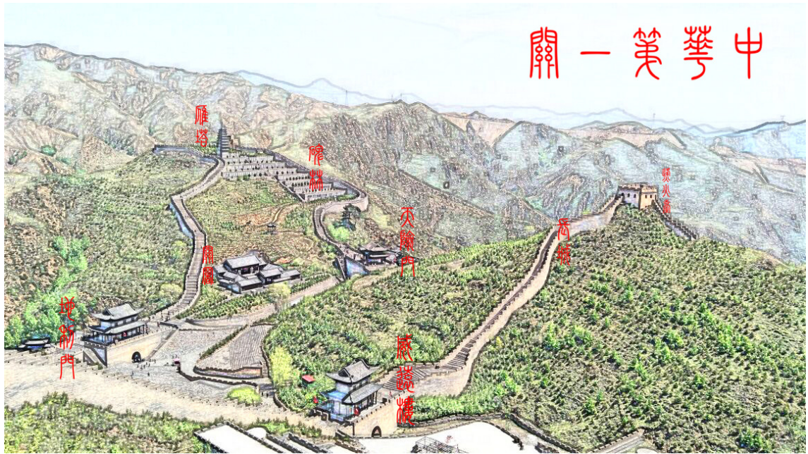
Figure 1. Schematic map of the location of the Guancheng building 图 1. 关城建筑位置示意图 ①

说山海关是天下第一关，是因为山海关是长城东起的第一道关隘。可山海关是平地建关，而雁门关则是在素有‘九塞之首’美誉的勾注塞上设关，建关历史更加悠久，地理位置更加险要，是中国北方最重要、最雄伟的长城雄关，是名副其实的中华第一关。”正是这次考察，罗老为雁门关题写了“中华第一关”这块匾额。下层悬挂“雁门关楼”的匾额。楼内空物，在历史上的主要功能是供士兵巡察、瞭望，以便发现敌情。与“天险”门形成九十度夹角的是“地利”门，利于防守。石座砖身，门匾上刻篆体字“地利”两字。此门坐向南北，门上建有宁边楼，两层阁楼式木构建筑，高12米，重檐歇山卷棚顶。据记载宁边楼原为“杨六郎祠”，两侧塑孟良、焦赞像，供设杨六郎铁刀一把，城楼上供设大炮两门。