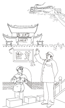
Figure 4. Line drawings 图 4. 线稿 ®