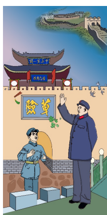
Figure 5. Coloring draft 图 5. 上色稿 ®