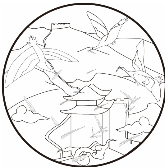
Figure 7. Pattern line drawings of the wild geese array passed 图 7. “雁阵过关”图案线稿 ⑦

以雁门关的民间传说为创意来源，设计方法上选用“雁阵过关”这一传说进行头脑风暴法，提取出大雁、芦叶、长城、雁楼等元素，并绘出线稿(见图 7：“雁阵过关”图案线稿)，图案设计中以雁门关、长城等景观作为图案的背景，将大雁、芦叶作为图案的主体，使观者在视觉上有一定的层次感和空间感，此图案还可以应用在文化创意产品设计中，如抱枕、团扇、书签等。图 8 为书签的设计，主体采用圆形，与圆角五边形吊坠形成方与圆的对比；材质上选用黄铜，厚度为 0.2 毫米；结构上采用镂空设计；图案进行平面化处理；色彩上采用蓝色和绿色的相近色，突出层次感；吊坠设计中利用有机线条进行分割、填色，使用篆体进行文字的书写，并突出雁门关三字，整体上达到实用、美观、方便携带的目的。图 9~11 分别是“雁阵过关”图案在抱枕、帆布袋和团扇中的应用，属于图案的衍生产品。这些创意产品的设计既有一定的实用功能，同时也承载着雁门关的地域文化，为宣传雁门关的文化提供了可能性。