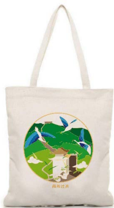
Figure 10. Canvas bags 图 10. 帆布袋 ®