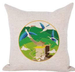
Figure 9. Throw pillows 图 9. 抱枕 ®