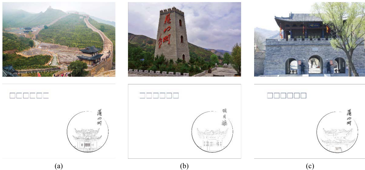
Figure 3. Postcard design (Left: (a) Middle: (b) Right: (c))

该套明信片的设计以雁门关的建筑造型为创作素材，进行明信片的设计(见图3：明信片的设计)。图中正面为照片，利用PS软件进行色调的调整，宣扬雁门关的地理位置、建筑结构等，背面则分别对明月楼和雁楼等建筑进行线条勾勒，结合极简主义的设计原则，并加以文字点睛，正面与背面形成面与点的对比，达到视觉上赏心悦目的目的。这些明信片的设计不仅可以满足游客的购物需求，还可以作为宣传雁门关文化的载体。