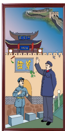
Figure 6. Framed renderings 图 6. 装裱效果图 ®

该装饰画分为前、中、后三个层次。前景以毛主席和士兵为主，采用大小对比法突出毛主席的主体地位，吸引观者的视线；中景以“关城东门(又称天险门)”为主，强化“天险”二字，弱化雁楼；背景则采用长城、烽火台等元素。色彩上选用具有厚重感的颜色，如赭石、浅黄、钴蓝色等，以体现出雁门关的地域特色和历史文化。