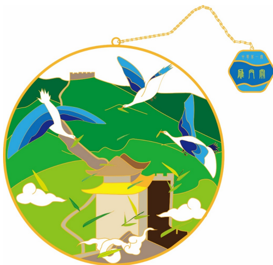
Figure 8. Bookmark of the wild geese array passed 图 8. “雁阵过关”书签 ®