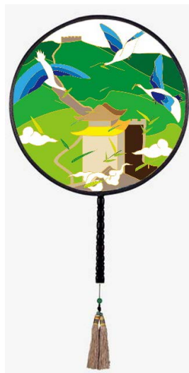
Figure 11. Circular fan 图 11. 团扇 ®