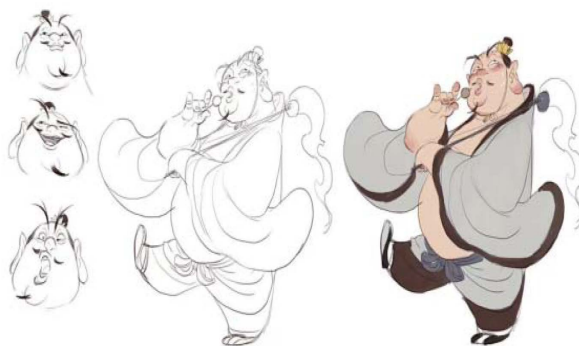
Figure 3. Taiyi Zhenren character design 图 3. 太乙真人角色设计 ®

显得格外出众, 与众多主要角色相比, 它的颜色更加鲜艳夺目。与众多仙人的神秘气息不同, 太乙真人的衣袂飘飘, 白发和金发交织在一起, 显得格外耀眼。使用柔和的粉红色和清澈的蓝色来展现人物形象。从一个瘦弱的苦行者变成了一位充满活力、热爱生活、热爱美丽的民间艺术家, 他用色彩描绘出一个充满欢乐的世界。使用多样的颜色符号, 给太乙真人带来了丰富多彩的世俗情感, 与申公豹沉闷的黑色形成了鲜明的对比, 如图 3 所示。