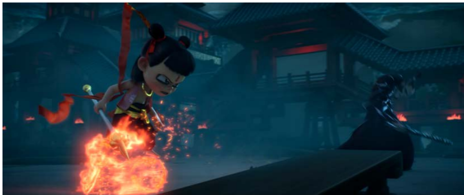
Figure 7. Props design of the Qiankun circle and the mixed heavenly Aya 图 7. 乾坤圈与混天绫道具设计 ⑦