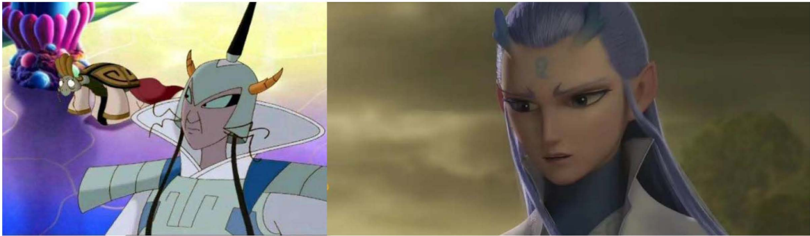
Figure 2. Comparison of Ao Bing's character design in "The Legend of Ne Zha" and "Ne Zha" 图 2. 《哪吒传奇》与《哪吒之魔童降世》中敖丙角色设计对比 ②

而昔日动画作品中的“反派”，龙王三太子敖丙在这部影片中却深受大家喜爱。敖丙是灵珠的化身，飘逸的蓝色长发一部分高高梳起，另一部分自然垂于身后，两绺垂于胸前；两个还未完全炼化的蓝色龙角长在额前，印堂中央是蓝色的灵珠印记；眉宇间洋溢着优雅的神采，鼻梁笔直如镜；穿上一件洁净而又华丽的白衣，上面绣满了柔和而又清新的浅蓝色花纹，语调沉稳而又自然，身体动作轻盈而又有力，与传统故事中被哪吒抽筋扒皮的敖丙形象完全不同，如图 2 所示。