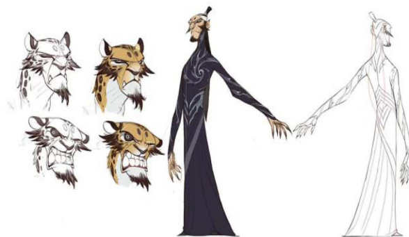
Figure 4. Shen Gongbao character design 图 4. 申公豹角色设计 ®

与太乙真人的世俗化相比, 申公豹的设色是符号化用色。黑色与黑豹的结合勾勒了一个狡猾、敏感、凶残的“腹黑”形象。黑色被视为黑夜和邪恶的象征, 申公豹有才却德才不配位, 但他的德行却无法得到元始天尊的认可。通过观看电影, 我们可以发现申公豹所出现的场景通常是一种令人沮丧的深沉气氛, 这与他的颜色相呼应。他的存在为故事的发展提供了重要的推动力, 并且为主角的性格增添了鲜明的对比, 如图 4 所示。