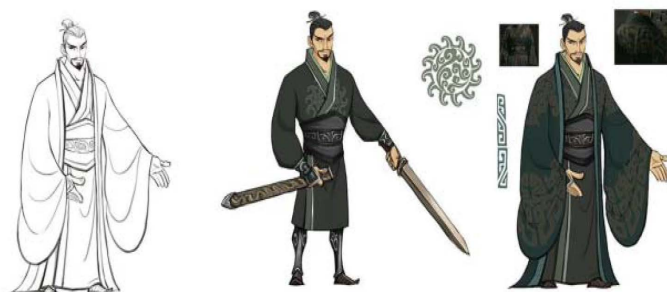
Figure 5. Li Jing character design