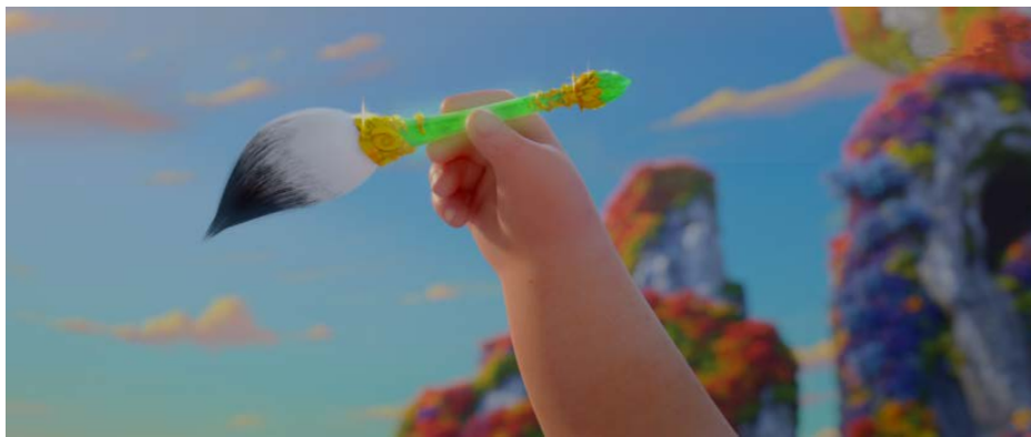
Figure 8. Design of finger pointing pen props 图 8. 指点江山笔道具设计 ⑧

“镜头语言”是电影和动画的基本组成部分。指点江山笔作为一种符号化存在，导演却几次给予它特写镜头，它是形象化的艺术。因此指点江山笔的存在意义极为重要。这把笔的造型犹如一支毛笔，它的碧绿色的笔杆上点缀着闪耀的金色装饰图案，宛如一件翡翠般的宝物。中国古代文化中，玉如意被视为吉祥美好的象征，笔杆上金色的镶边花纹代表着高贵、辉煌，象征着智慧和大光明，莲花与祥云也是其中不可或缺的组成部分。白金交织，构成一幅神圣而又优雅的画面，象征着仙家的美丽与纯洁。金色的装饰和翠绿的笔杆、黑白的笔头相互映衬，形成了一种强烈的对比，同时，在保持实物原有特征的基础上，运用了阴阳八卦图的象征意义，以此来表达自然之美，以及道家之精髓。在这部电影中，指点江山被描绘成一把能够帮助人们解开迷雾的钥匙。通过对中国传统水墨符号的灵活运用，来回挥笔的符号打破了现实世界的局限，进入了一个全新的文明领域，如图 8 所示。