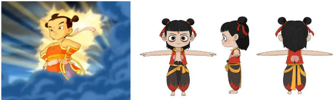
Figure 1. Comparison of Ne Zha's character design in "The Legend of Ne Zha" and "Ne Zha" 图 1. 《哪吒传奇》与《哪吒之魔童降世》中哪吒角色设计对比 ①

电影《哪吒之魔童降世》中，哪吒与敖丙误打误撞托生为混元珠的魔丸与灵珠。哪吒作为我国传统文化中的一个重要的文化符号，一直被大家当作是正义的代表。“莲花荷叶衣，头顶冲天髻，脚踩风火轮，手拿乾坤圈，双臂缠着混天绫，一身正气。”这是我们童年记忆中的哪吒形象。当电影首次公布哪吒的形象时，大多数观众都感到非常不满，认为他与传统的哪吒形象有很大的差异。他的头顶有一个锅盖般的刘海，额头上有一个红色印记；黑眼圈像烟熏妆一样，显得非常难看；脸上长满了雀斑，鼻梁塌陷，显得格外可怜；身着红色镶黄边坎肩，上面绣着精美的莲花图案，腰间系着闪耀的黄色腰带，脚上光滑的鞋子，敞开双臂，让自己洋溢着温暖的气息；他的双手总是紧紧地握在裤腰里，显得既拽又痞；这个人曾经是一个善良勇敢的英雄，但现在却变得暴躁易怒，与过去的形象大相径庭。如图 1 所示。