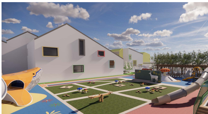
Figure 3. Exterior renderings of the buildings

神和思想。所以在育启成新社区幼儿园的设计中, 在开放的活动区设置了能够将孩子们包围起来的山洞供孩子们在其中自由穿梭和玩耍, 开洞的假山造型增添了空间的生动和层次, 避免了孩子们在过于大的造型中感受到压抑感[3]。给孩子营造出一种亲切的感觉。空间造型设计上虚实结合, 既满足了孩子们的玩耍交流空间需求, 同时也有较为安静和可以独处的私密空间(如图4)。