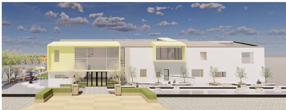
Figure 2. Architectural renderings 图 2. 建筑效果图 ①

建筑外观运用极简主义风格, 采用的白色粉刷墙, 在建筑的立面上做出起伏变化, 设计了几个突出的窗户设计, 在开窗上选择彩色窗户作为点缀, 让建筑整体显得更加青春、活泼(如图 2)。