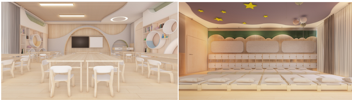
Figure 7. Renderings of the indoor classroom space

在休息区的吊顶设计上采用了夜空星光和卡通的设计元素装饰,将休息区的窗帘关闭之后,营造夜晚宁静的氛围,来促进孩子们的睡意,再放一些摇篮曲或者轻音乐,让孩子们能够快速的沉静下来,迅速进入到睡眠状态,提高幼儿的睡眠质量[7](如图7)。