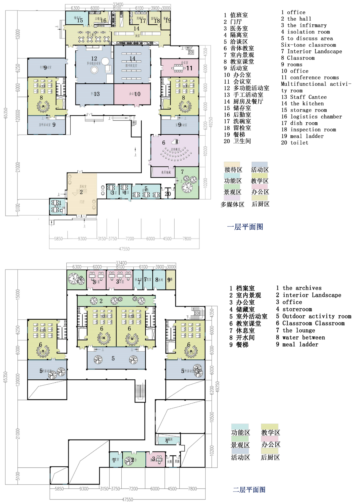
Figure 6. Interior layout and functional zoning map 图 6. 室内平面布置与功能分区图 ①