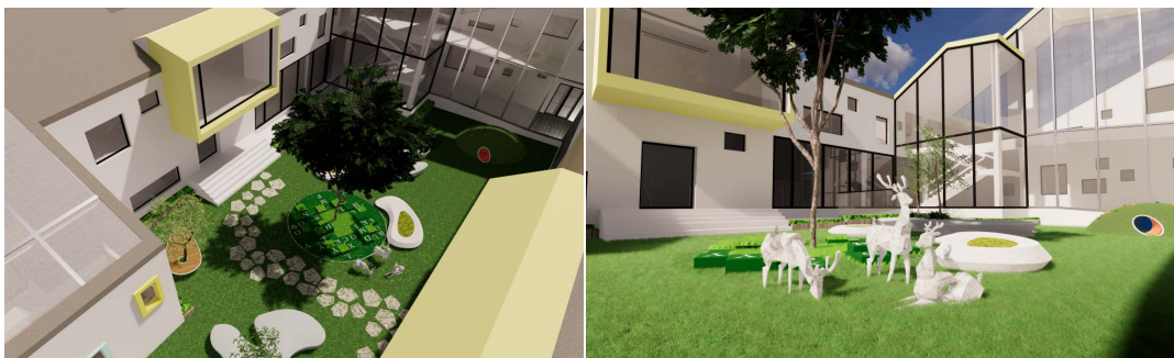
Figure 5. Exterior landscaping of the building

在建筑中有一个开放式的空间,顶部没有封顶,在其中专门为其设计了一个景观场地。其中有一棵欲要冲出建筑的大树,设计的寓意是希望孩子们可以在这里能够活泼发育,学习生活技能和提高自己的身心健康发展,逐渐健康成长的象征(如图5)。