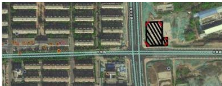
Figure 1. Program site

1)。同时本地属于正在开发建设地，周边环境适宜，空气新鲜，交通安全，作为幼儿园开发是很有意义和价值的。首先建筑选址在内陆平原地区，地势平坦，开发难度较小，而且周边绿树环绕，靠近公园，环境十分优美宜人。此外建筑所在的位置上有着便利的交通、大型商业区和大型社区，为幼儿园的发展丰富了广泛的硬件基础条件。