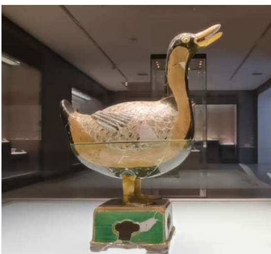
Figure 1. Jingdezhen duck shaped aroma diffuser

传统图案在景德镇文化中占据着举足轻重的地位，它们不仅是艺术的展现，更是历史与文化的载体。青花瓷的典雅花纹、粉彩瓷的绚丽图案，这些传统图案以其独特的艺术魅力，成为现代文创设计中不可或缺的元素。设计师们巧妙地将这些图案融入到现代产品的设计之中，使得家居用品、时尚配饰、数码产品等都散发出浓郁的文化气息，同时又不失现代设计的简洁与时尚(如图 1)。在这一过程中，设计师们不仅注重图案的美学价值，更加注重其在现代生活中的实用性和舒适性。通过对传统图案的重新解读和创新应用，设计师们创作出了一系列既具有传统韵味又不失现代审美的文创产品，这些产品在国内外市场上受到了广泛的欢迎和认可。