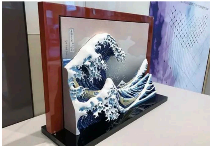
Figure 2. Decorative objects in 3D printed ceramics 图 2. 3D 打印陶瓷的装饰品 ②