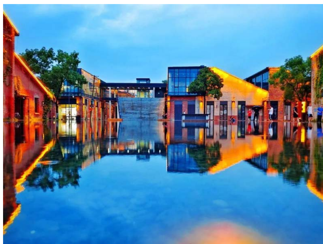
Figure 3. Taoxichuan cultural and creative district 图 3. 陶溪川文创街区 ①