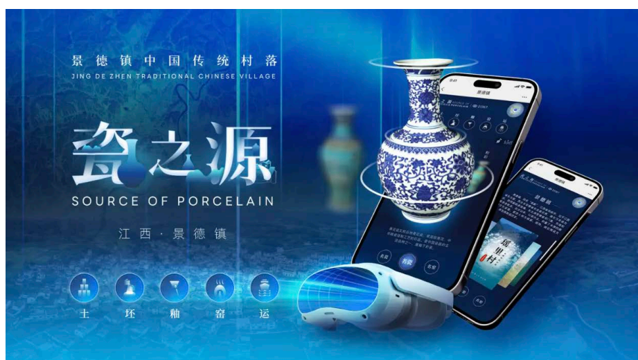
Figure 4. Digital presentation of Jingdezhen ceramics 图 4. 景德镇陶瓷数字化呈现 ②