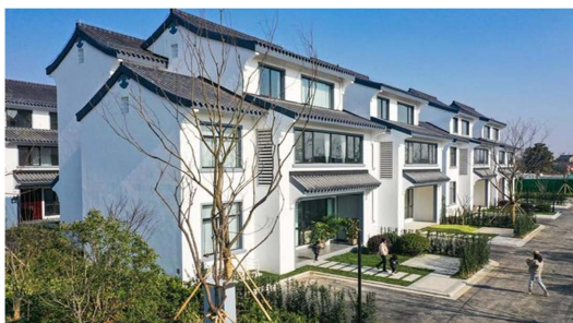
Figure 3. Yin Xingtai beautiful village phase I 图 3. 殷杏泰美丽乡村一期 ②

舞台和无法被定义的场所。挖掘村落文化、体验业态，通过设计为产业赋能。统筹教育、文化、旅游等多方面发展，打造“宜学、宜业、宜游、宜居”的创新创业类特色小镇模板。杏塘村大都为农田用地，乡村发展空间受限。民居大多数在 80 年代建成，房屋条件老旧失修，部分房屋已是危房状态无改造条件和保留价值。针对于村落中生活空间以及配套设施发展滞后的问题，应倡导微更新理念。在原有的基础上进行改造，尊重村庄人的自我审美与自主性，以延续和改善村民日常生活与促进相关文化、产业发展为目的。如“殷杏泰美丽乡村一期”(图 3)集中居住区分布于泰村和杏塘村两个片区。样板房室内装潢风格为典雅的新中式，一楼设置了客厅、餐厅、厨房、客卧；二楼含有儿童房、客卫、主卧与书房的套间，在套间中还有衣帽间、卫生间和一个小书房，再加上一个通透的大阳台，设计非常人性化。充分肯定邹区镇殷杏泰产教融合试验区不断优化基础设施配套，推进全域美丽乡村建设的做法。于泰村产业园区之中规划绿色餐厅(图 4、图 5)，以制作当地美食为主，如小杏鱼圆，一方面承载着当地居民的集体记忆，另一方面游客也能感受到当地的饮食文化。