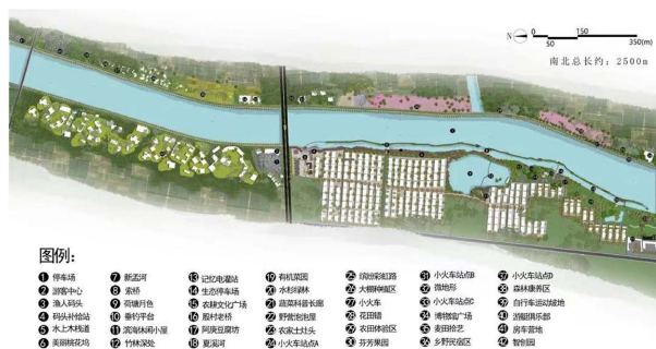
Figure 2. Public space node diagram 图2. 公共空间节点图 ①