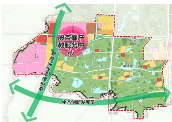
Figure 1. Yin Xingtai development space structure diagram 图1. 殷杏泰发展空间结构图 ①

选择和类型转化,在村落空间形态上常用分层手法,以布局、街巷、河湖、建筑为不同等级,寻求其原型与变形,并用于转译之上。如构建“两湖”融合创新区,形成一带一廊一中心的空间结构:即新孟河生态保护带、挣中路融合创新走廊,现代农业产业中心(图1)。实现农业空间、生态空间、生活空间三线划定,满足村民集中居住空间需求、产业和公服空间需求以及耕地种植等需求。根据村庄肌理,构建与代生活以及村落发展相匹配的“公共发展区块”,并予以串联乡村特色节点,如新孟河、博物馆、康养区等,协同提升乡村风貌(图2)。钟楼区生态乡村的发展强调八村联动,以殷杏泰为引擎,构建核心区域实现生态共治、产业融合、城乡共生。在区域中以新孟河为轴,统一规划乡村村落漫游线,结合轴线与片区打造村容村貌,提升村庄的旅游价值。