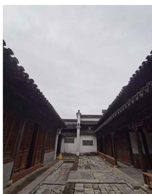
Figure 3. Eaves 图 3. 屋檐