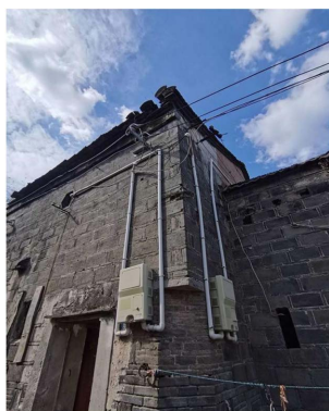
Figure 2. The facade of the building 图 2. 建筑外立面

然而，值得我们关注的是，村内其他历史建筑的命运却并不乐观。在岁月流逝和现代农村建设发展的冲击下，这些历史建筑的数量逐渐减少，品质也日渐下滑。如何在保护省级文保单位的同时，也对村内其他历史建筑给予足够的关注，这是一个亟待解决的问题。我们不能让这些历史建筑在发展的潮流中被淹没，否则将是对我国历史文化的不负责任。因此，相关部门应采取措施，对村内其他历史建筑进行维护和修复，以保护我国丰富的历史文化遗产。