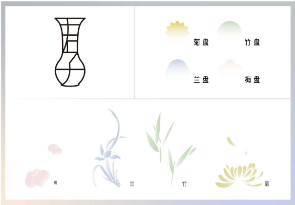
Figure 3. Auxiliary graphic design display diagram 图 3. 辅助图形设计展示图

醴陵“君子有醴”釉下五彩瓷文创茶具产品的辅助图形设计共两款(见图 3)，一款是根据扁豆双禽瓶的轮廓外形，横向均分为四等份，将“君子”二字融入其中，形成辅助图形的图案设计。另一款则根据“君子有醴” LOGO 的色调进行设计梅、兰、竹、菊的图案设计，将盘子几何化设计，搭配渐变色彩，使其拥有远山的意境。