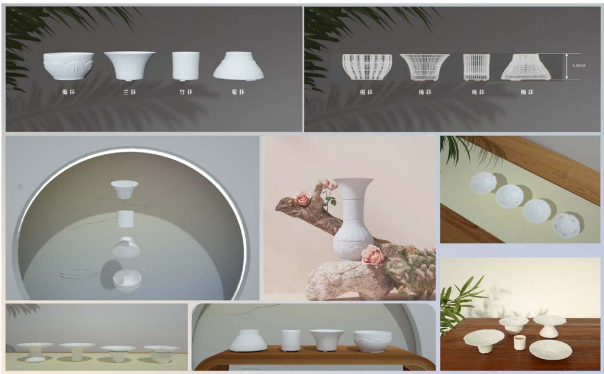
Figure 1. “Junzi You Li” product renderings 图 1. “君子有醴”产品效果图

“君子有醴”的另一巧思是茶杯不仅能用作饮茶的器具，也能另有别用。当瓷盘装有洗好的果子时，茶杯可作为底座，将果盘置于杯顶，果子上的水珠可顺着盘子的沥水孔滴入“底座”，一则以免多于水珠滴在桌面难以收拾，二则高脚托盘美观大方，不论是待客或是自家使用，均能使人感到心旷神怡，满足新时代人们追求个性又不失产品功能性与美观性的需求。