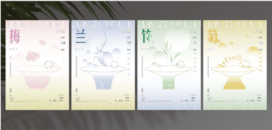
Figure 5. Poster design display 图 5. 海报设计效果图

子有醴”海报设计使用“君子有醴”的辅助图形进行版式设计(见图 5)，素雅而美观，富有视觉张力，能够有效地宣传产品。