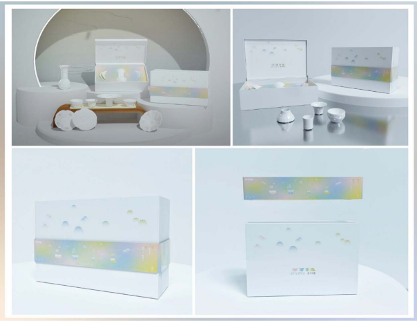
Figure 4. Packaging design display drawing 图 4. 包装设计效果图

“君子有醴”产品的包装设计是不可或缺的，其设计主要定义为简约的风格，运用简单的盒型，以及环保的材料，进行设计，主要将辅助图形运用其中，使其拥有一定的系列感(见图 4)。