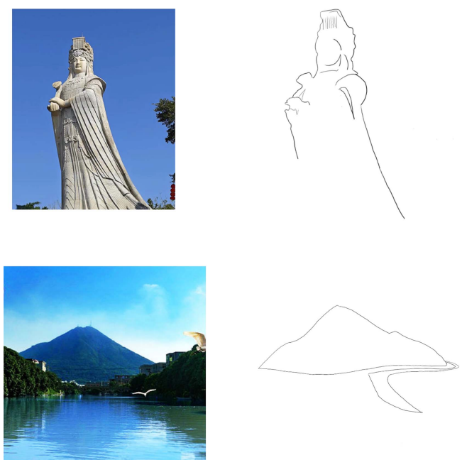
Figure 3. Extraction design of regional elements of Putian city logo 图 3. 莆田市城市标识地域性元素提取设计 ②