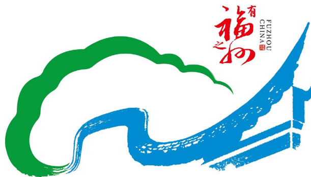
Figure 4. Fuzhou city logo design 图 4. 福州市城市标识设计 ①

以福建省三明市的城市标识设计为例(见图 5)。三明城市品牌形象在宣传的过程中确定“风展红旗 如画三明”八字宣传主题词，主题词既是三明独特的文化底蕴的凝练，又展现出城市未来的目标愿景。三明 LOGO 主要采用三种颜色，分别是红色、绿色与蓝色。“风展红旗”出自毛泽东在三明行军途中所作的诗词“风展红旗如画”(《如梦令·元旦》)，红色是中华人民共和国国旗的底色，红旗飘扬迎风展，象征着历经战争岁月获得的革命胜利，正迎合目前三明全力推进革命老区高质量发展示范区建设的目标。