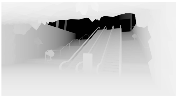
Figure 1. The exit atmosphere is created 图 1. 出站口氛围营造

黑陶作为一种原始文明的产物,对其装饰形式的创新与整理是必要的,因此,应以继承传统精髓、体现时代精神为前提,并遵循必要的设计原则,以达到和谐与融洽[5]。本方案旨在打破黑陶文化的传承和发展模式的局限,让广大群众在城市公共空间中以更为真实、沉浸感的视觉体验认识山东黑陶的历史、工艺和特点(见图 2),为山东地域文化的发展开辟新的空间。