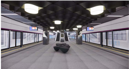
Figure 8. Interior space rendering 图 8. 内部空间效果图