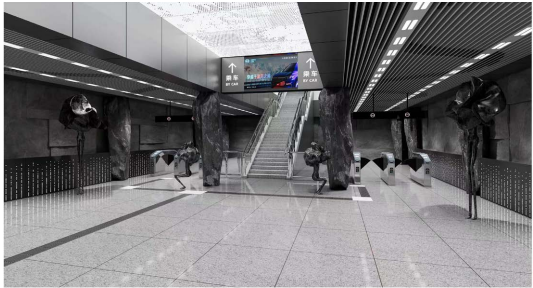
Figure 6. Interior space rendering 图 6. 内部空间效果图

以黑陶为设计灵感的地铁站室内设计将传统文化与现代交融，利用灯光、显示屏等现代工具，为乘客提供了一个独特而舒适的空间，通过艺术性的装饰和功能性的布局(见图8)，打造城市的一处文化景点，为乘客带来愉悦的出行体验。