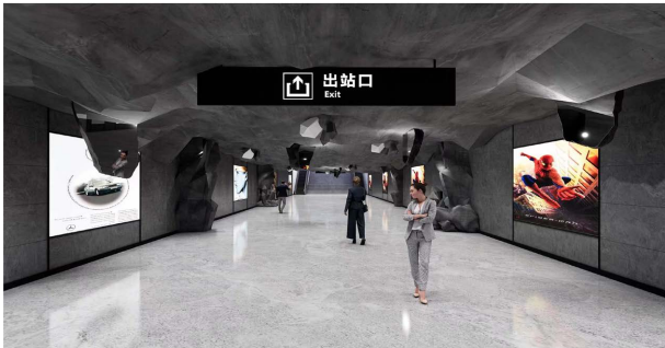
Figure 4. Outbound space rendering 图 4. 出站空间效果图

在部分空间设计中，天花与墙面被打造成类似未经雕琢的石壁，同时在天花的石块中附着镜面材质，让人们换一个空间、换一种视角审视自己的内心世界；在符号的运用上，主要将黑陶的镂空花纹抽象化，同时提取罐口、罐身等曲线形态，赋予空间灵动与活力。在艺术装置的设计上，也将黑陶的特征与当代的审美价值相结合，打造沉浸式的空间体验(见图 5)。