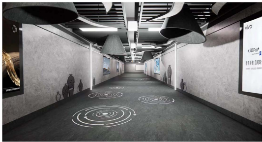
Figure 7. Interior channel rendering 图 7. 内部通道效果图