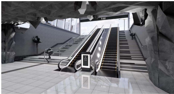
Figure 5. The effect of the exit 图 5. 出站口效果图