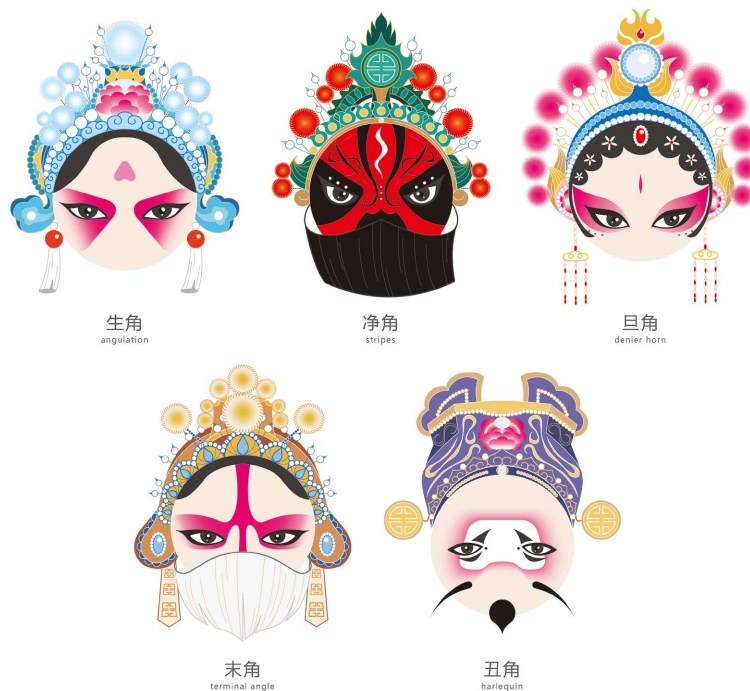
Figure 2. Creative design of Shandong Bangzi Opera Culture 图 2. 山东梆子戏文化创意设计 ①

在文创设计方面,依据生旦净末丑角色的性别、年龄、职业以及社会地位等特点,将舞台上的角色划分为生角、旦角、净角、末角和丑角五种类型,并根据这五种角色的特点进行创意设计(如图 2)。生角的设计为在额间画一个三角,代表英俊,体现男性正面角色的英勇和正直。旦角的则是在额头上鬓角处