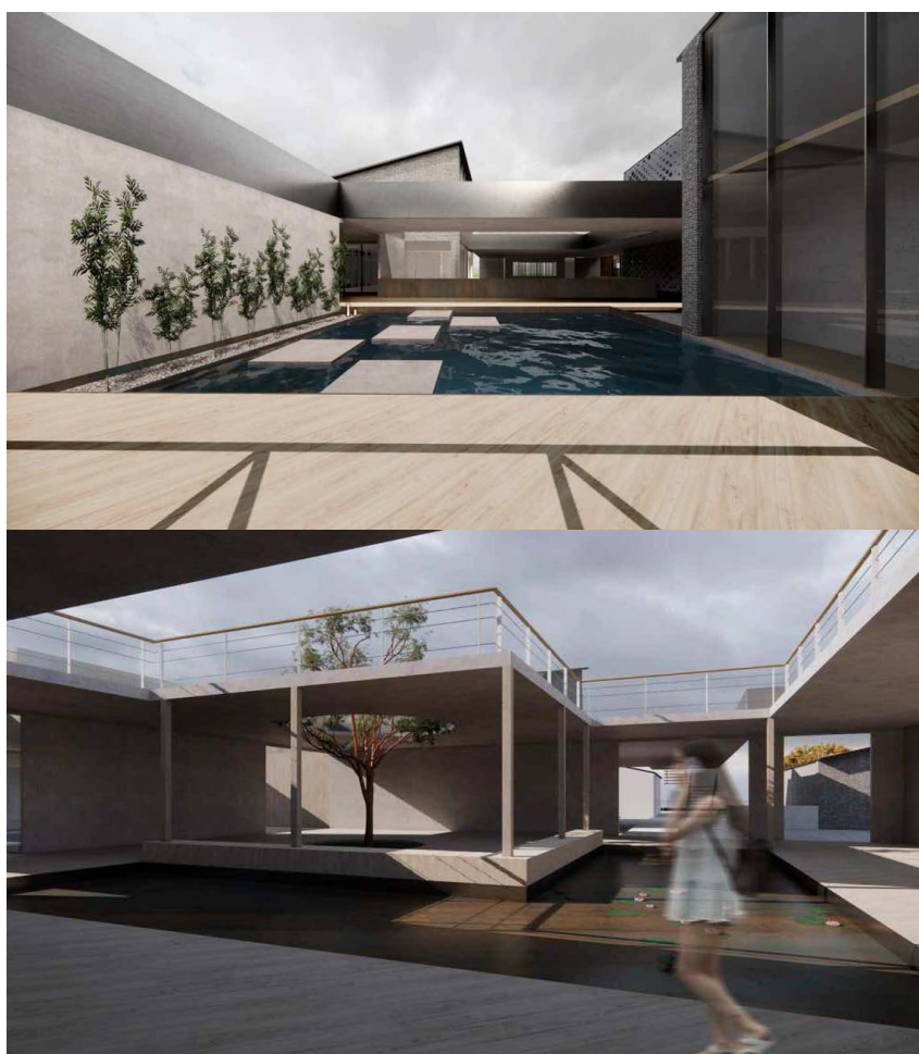
Figure 3. Renderings of the quiet space

整个观景平台的设计充分考虑了人与自然的互动, 旨在为住客提供一个可以放松身心、享受自然美景的静谧空间。无论是清晨的日出还是夜晚的星空, 这个平台都是观赏和体验自然之美的理想之地。