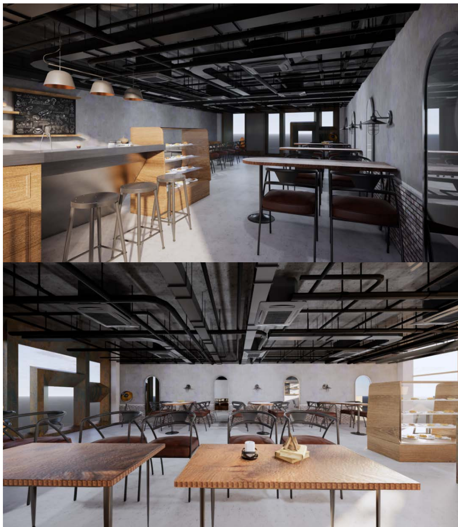
Figure 7. Renderings of the cafe space 图 7. 咖啡厅空间效果图

既舒适又具有社交属性的餐饮空间。我们相信, 这样的设计将吸引更多的年轻顾客, 让他们在享受美食的同时, 也能体验到独特的现代生活方式。