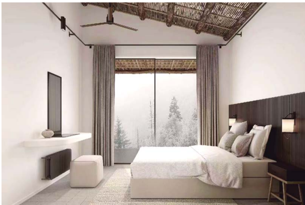
Figure 8. Guest room space rendering diagram 图 8. 客房空间效果图