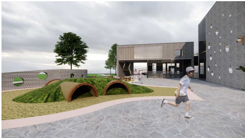
Figure 2. Leisure square renderings 图2. 休闲广场效果图

休闲广场位于一层, 设计巧妙地融入了工业元素, 通过将废弃管道巧妙地埋设于地下(见图2), 既实现了资源的再利用, 又增添了一抹工业美学。广场周围的围墙借鉴了当地传统院落的建筑风格, 开设的圆形洞口与餐厅水滴状的开窗设计相映成趣, 不仅确保了良好的通风效果, 也为整个空间带来了视觉上的美感和艺术性的提升。这种设计手法巧妙地将传统与现代、自然与工业元素融合, 创造出一个既实用又富有艺术气息的休闲空间。