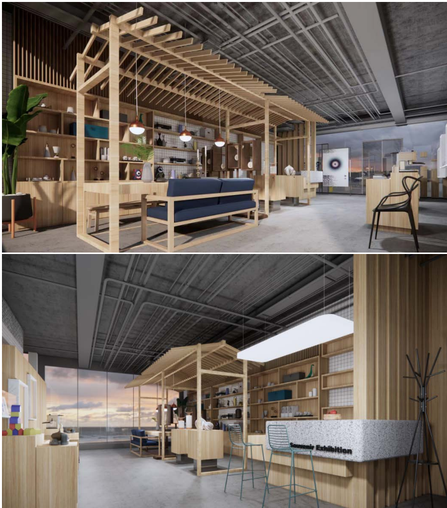
Figure 6. Renderings of the cultural and creative space 图 6. 文创空间效果图