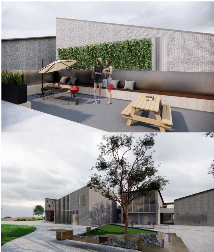
Figure 4. Renderings of the leisure space 图 4. 休闲空间效果图

整体而言, 本民宿休闲空间的设计充分考虑了人与自然的和谐共处, 通过精心布局和细节处理, 旨在为住客提供一个既能放松身心, 又能享受自然美景的理想休闲场所。