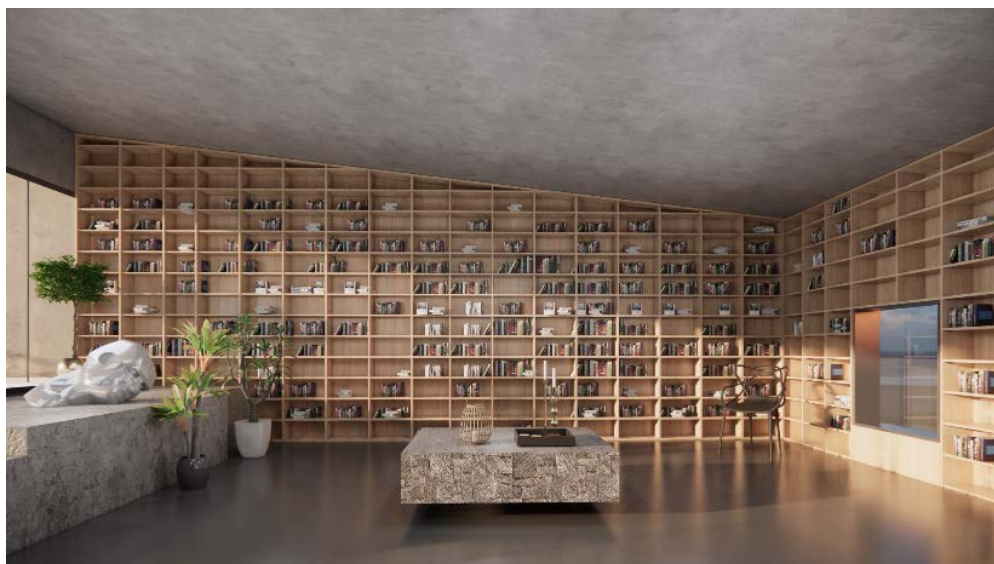
Figure 9. Study space renderings 图 9. 书房空间效果图

在空间布局上,我们尽量减少隔断的使用,以增强空间的流动性和开放性。书房中大面积使用深灰色,营造出闲适私密的氛围,而红色、黄色等饱和度高的色彩点缀,为空间带来视觉冲击,增添了活力。这样的设计不仅满足了住客的阅读需求,也为他们的休闲时光提供了一个充满文化气息的场所。