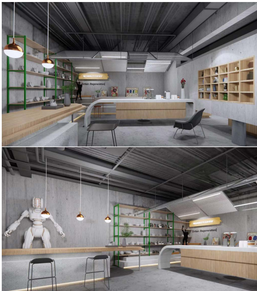
Figure 5. Renderings of the intangible cultural heritage manual experience center 图 5. 非遗手工体验中心效果图

整体而言, 锡雕体验中心的设计旨在提供一个多功能的空间, 让住客在休闲和社交的同时, 能够亲身体验和学习锡雕这一传统手工艺, 从而加深对莱芜文化的理解和认同。通过这样的设计, 希望能够让锡雕艺术得到更广泛地传播和认可, 同时也为住客留下深刻的印象和美好的回忆。