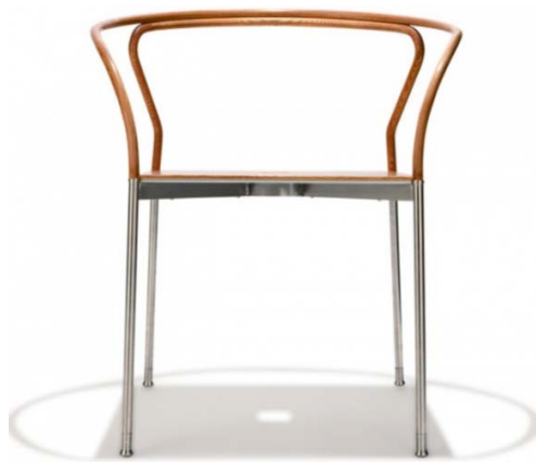
Figure 5. Money chair 图 5. 钱椅 ®

朱小杰设计的“钱椅”(见图 5)在保持明式圈椅外型的基础上,采用了混凝土的原理,将钢筋串在极细的原木圆柱中,使其稳定扎实。同时,以手工方式缝制牛皮坐垫,白色的明线将坐垫固定在深色的原木框中,实现了“古典”和“现代”的和谐混搭。这一设计还是庄子“然则我内直而外曲,成而上比”的体现。