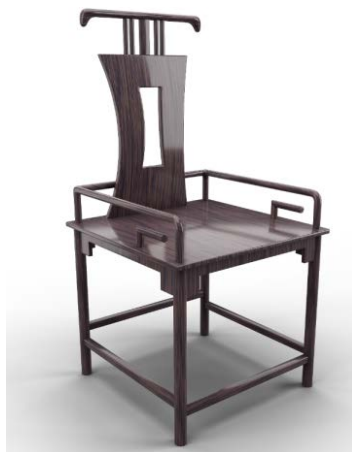
Figure 6. "Pattern" chair 图6. “回纹”椅 ®

回纹椅(见图6)的主要设计元素是回纹纹样。这种纹样以连续的回旋线条折绕组成,形成独特的几何图纹。回纹椅作为中国传统家具的一种代表,其独特的设计和深厚的文化内涵使得它在现代社会中依然保持着强大的生命力和吸引力。