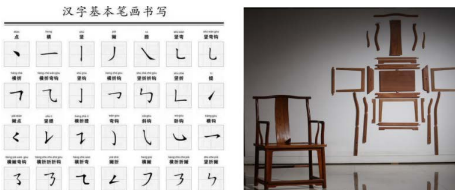
Figure 1. Basic structure of Chinese character formations

家具造型元素可以概括为点、线、面、体等这几类基础要素，汉字构形中的基本的结构有点、横、竖、撇、捺、提、折、钩这八种，而通过穿插、相接等结合异变后的结构更多，因此汉字与家具在基础构形法则上有一定的相似性(见图1)。