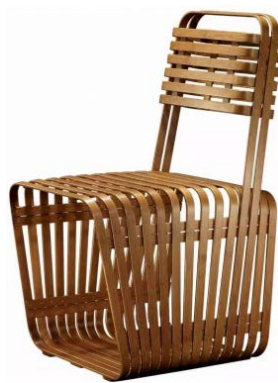
Figure 7. 椅君子 图7. Chair gentleman ®

新中式家具在材质上多选用天然木材如红木、楠木等,这些材质不仅质地优良而且具有自然的美感。例如石大宇设计的椅君子(见图7),其对于竹材材质和工艺的追求与吴越文化中崇尚自然、注重细节的理念不谋而合。