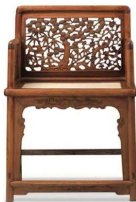
Figure 2. Yellow flower pear pine bamboo plum pattern rose chair 图2. 黄花梨松竹梅纹玫瑰椅 ②

植物类纹样的题材广泛，主要包括花卉、树木、藤蔓等。花卉是最常见的题材之一(见图2)，如牡丹、莲花、梅花等，这些花卉各自具有独特的象征意义。树木类纹样如松树、竹子等，则常以其坚韧不拔、高风亮节的品质而受到人们的喜爱。在家具上，植物纹样常被雕刻在柜门、屏风等部件上，增添家具的文化气息和观赏价值。