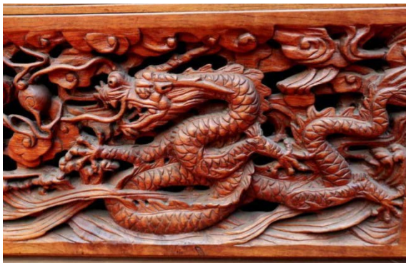
Figure 3. Legend of dragon pattern furniture 图 3. 龙纹纹样家具图例 ®